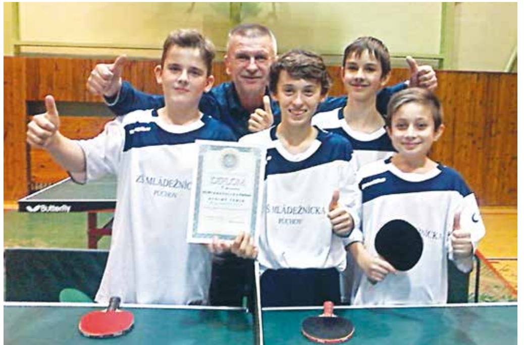
Stolní tenisti Základnej školy Mládežnícka v Púchove prepisovali históriu. V regionálnom finále v Považskej Bystrici zvíťazili a prvýkrát v histórii postúpili do krajského finále.