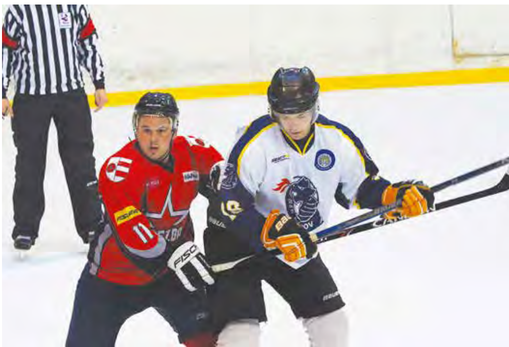
Muži MŠK Púchov nezaváhali ani na Orave a v Dolnom Kubíne po streleckom koncerte v záverečnej desaťminútovke hladko vyhrali. V čele tabuľky zvýšili náskok na tri body.