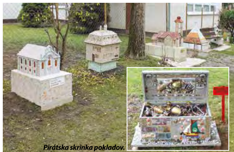
Pirátska skrinka pokladov.