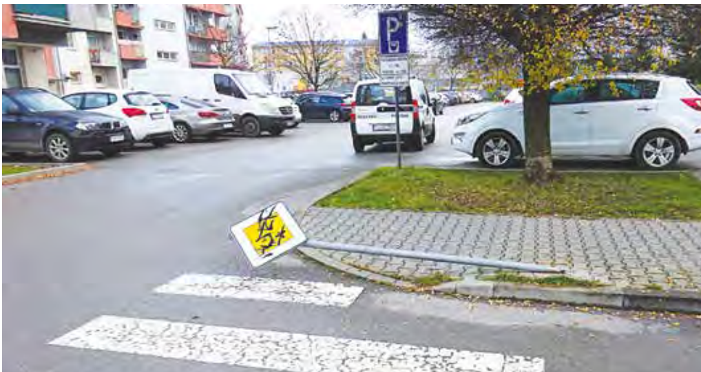
Na Moravskej ulici takto skončila dopravná značka označujúca hlavnú cestu. Nevedno, či je to dielo vandalov alebo nepozorného vodiča.

Púchovskí mestskí policajti preverovali telefonické oznámenie, podľa ktorého sa pred bytovkou vála neznámy opitý muž. Hliadka na uvedenom mieste nikoho nenašla, pri ZŠ Mládežnícka však našla opitého muža z Námestia slobody, ako sa vála po chodníku. Muž bol evidentne pod vplyvom alkoholu, nevládal stáť na nohách. Hliadka ho preto previezla do miesta trvalého bydliska, kde si ho prevzal jeho syn. Priestupok proti všeobecne záväznému nariadeniu mesta Púchov je v riešení.