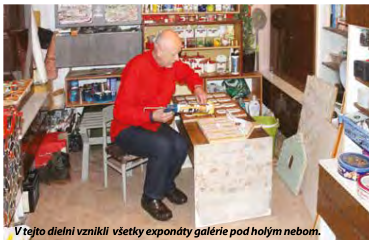
V tejto dielni vznikli všetky exponáty galérie pod holým nebom.