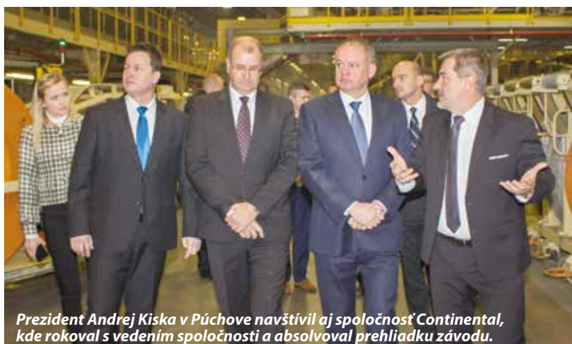
Prezident Andrej Kiska v Púchove navštívil aj spoločnosť Continental, kde rokoval s vedením spoločnosti a absolvoval prehliadku závodu.