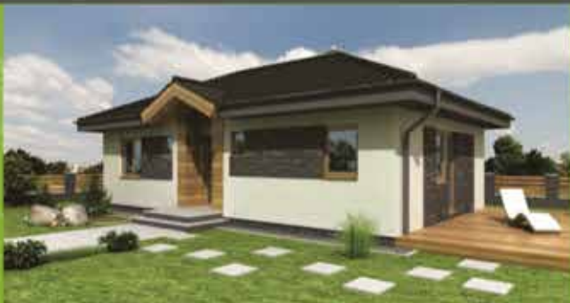
Murovaný dom i6 na kľúč, zastavaná plocha 94 m 2 Cena 77.500,- €

VÝSTAVBA RD NA KLÚČ Moravská 1881, Púchov mob: 0905 795 637 koreny@i-house.sk www.i-house.sk