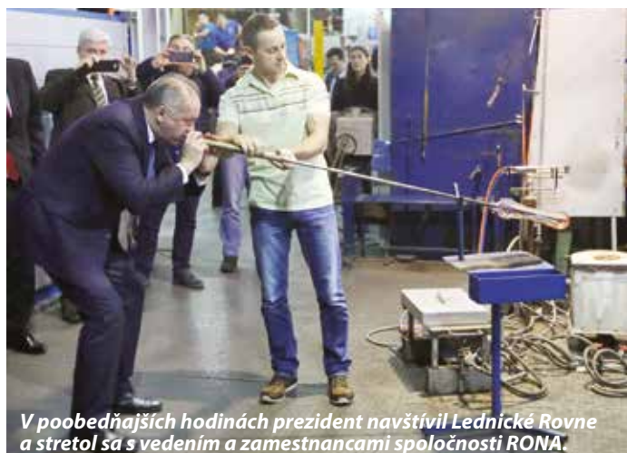
V poobedňajších hodinách prezident navštívil Lednické Rovne a stretol sa s vedením a zamestnancami spoločnosti RONA.