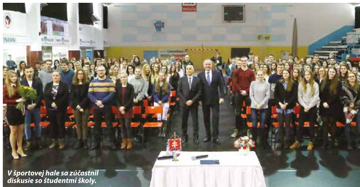
V športovej hale sa zúčastnil diskusie so študentmi školy.

18. január 2018 sa zapíše do 94-ročnej histórie Strednej odbornej školy obchodu a služieb v Púchove ako deň, keď nás poctil návštevou prezident Slovenskej republiky Andrej Kiska.