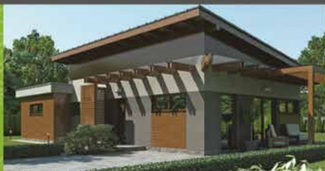
Predaj RD, Nové Nosice, zast. plocha 105m 2 , pozemok 870m 2 cena 132 500 €