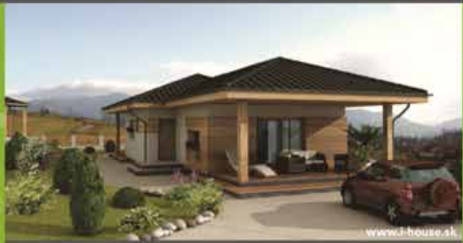
Murovaný dom i8 na kľúč, zastavaná plocha 130 m 2 Cena 87.400,- €