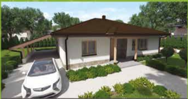
Montovaný dom i22 na kľúč, zastavaná plocha 157 m 2 Cena 109.500,- €