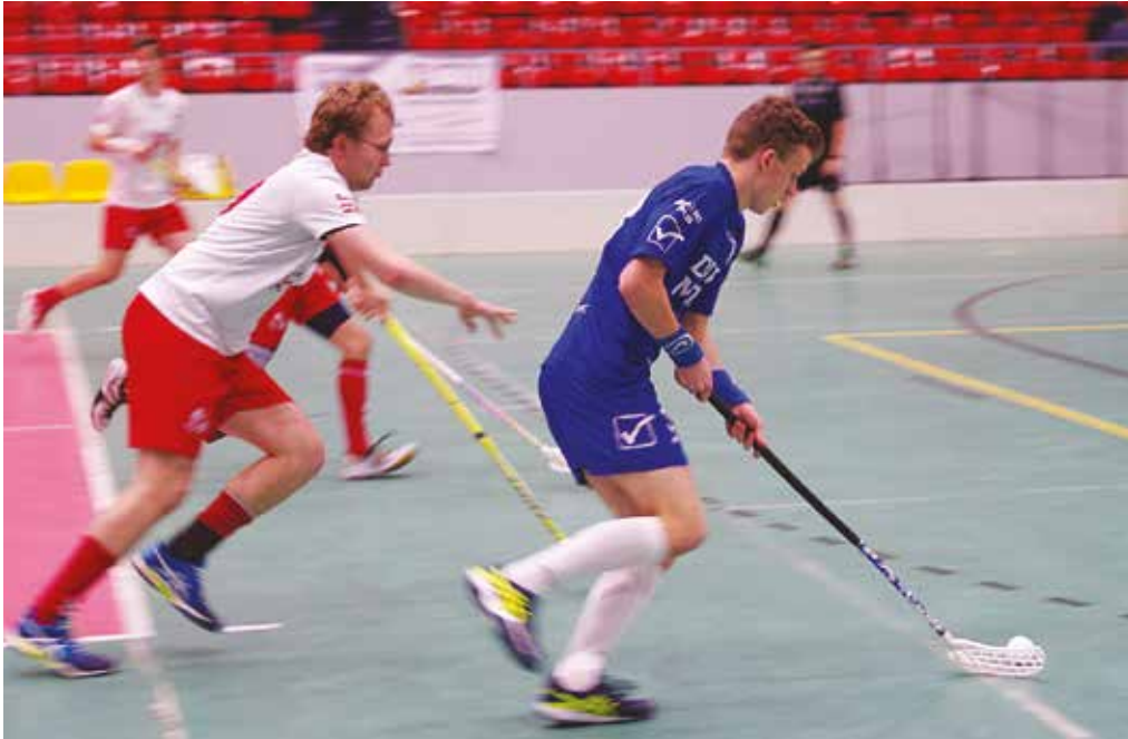
V 17. kole prvej florbalovej ligy Púchovčania (v modrom) vďaka skvelému finišu v záverečnej tretine otočili výsledok z 5:9 na 12:9. Podobný finiš v Partizánskom im už ale na otočenie nestačil.