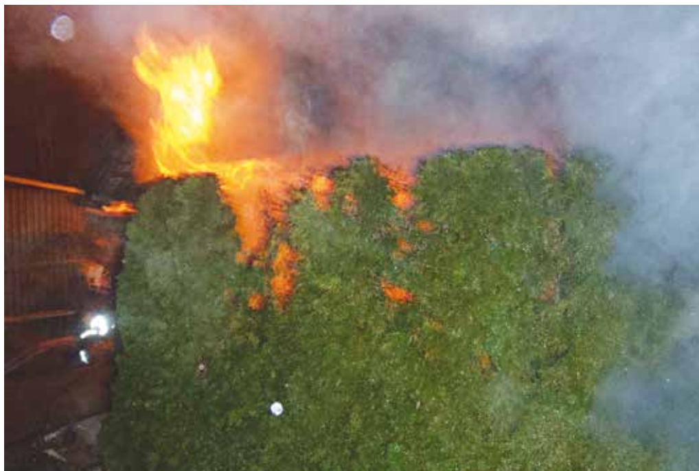
Požiar hospodárskeho objektu v Horných Kočkovciach zamestnal nielen púchovských, ale aj považskobystrických hasičov.