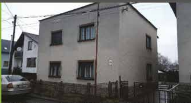
Predaj RD, Beluša, podl. plocha 150m 2 , pozemok 1218m 2 cena 109 000 €

REALITNÁ KANCELÁRIA Moravská 1881, Púchov mob: 0905 795 637 koreny@i-reality.sk www.i-reality.sk