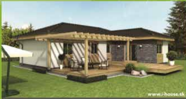
Montovaný dom i5 na kľúč, zastavaná plocha 124 m 2 Cena 87.900,- €