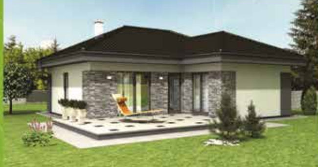
Predaj RD, L. Rovne, zast. plocha 99m 2 , pozemok 1203m 2 cena 117 000 €