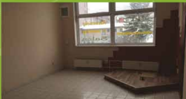
Predaj, Komerčný priestor, Púchov, Moyzesová ul. 50m 2 , cena 59 900 €