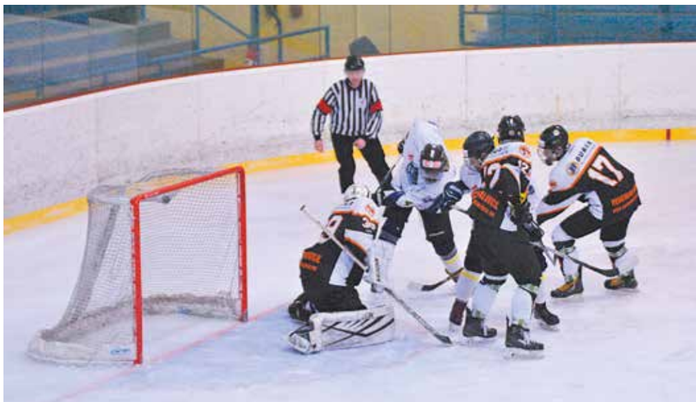
Extraligoví dorastenci si pripísali cez víkend dve cenné výhry nad mužstvami z východu republiky. V boji o vyhnutie sa baráži mimoriadne dôležité.