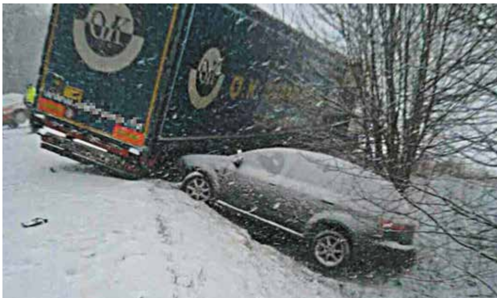
Hromadná nehoda pri Mestečku si vyžiadala dvoch zranených.

Na oddelenie mestskej polície oznámila žena, že pred budovou mestskej polície jej niekto poškodil zaparkované osobné motorové vozidlo. Neznámy vodič jej mal poškodiť prednú časť automobilu. Mestskí policajti jej odporučili, aby prípad nahlásila na okresný dopravný inšpektorát v Považskej Bystrici a informovali, že v nasledujúci deň previera kamerový systém.