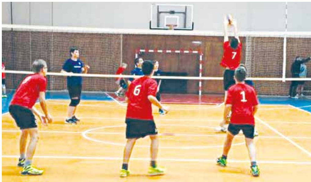
Mladí žiaci Volejbalového oddielu 1970 MŠK Púchov si so svojimi súpermi opäť hladko poradili a obe družstvá sa v čele súťaže.