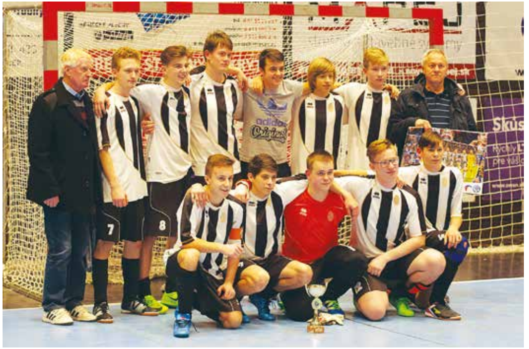
Dorastenci FK Streženice pózujú s víťazným pohárom bezprostredne po skončení halového futbalového turnaja O pohár predsedu komisie mládeže Oblastného futbalového zväzu v Považskej Bystrici.

nica – Plevník 3:4 (Krasňan, Jandušík, Babiar – Kurus 2, Brigant, Nemčík), Dolné Kočkovce – Pružina 1:2 (Pilát – Gálik, Olšovský), Streženice – Dohňany 0:6 (Čvirík 2, Černoško 2, Štefánik, Bodzík), Jasenica – Dolné Kočkovce 3:3 (Krasňan 3 – Pilát 3), Plevník – Dohňany 1:3 (Hanaulík – Štefánik, Černoško, Jánoško), Pružina – Streženice 1:4 (Olšovský – Pojezdal, Šlesár 2), Dolné Kočkovce – Plevník 4:2 (Pilát 3, Lacko – Nemčík, Kurus), Streženice – Jasenica 4:3