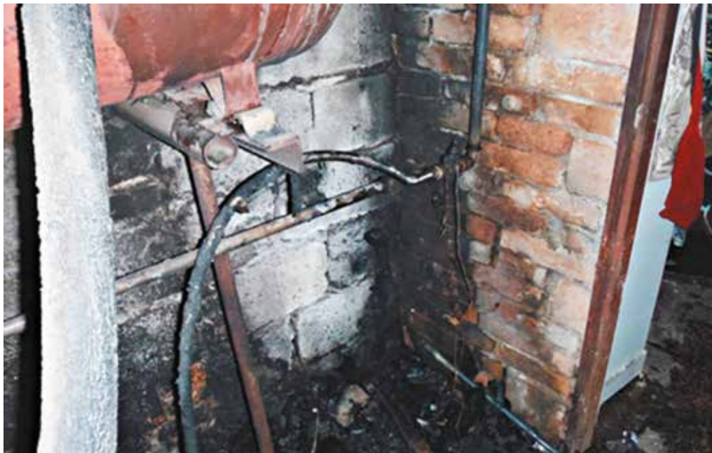
Pri požiari v kotolni rodinného domu v Streženiciach sa zranil jeden človek.

Dopoludnia prijala hliadka MsP telefonické oznámenie o tom, že v Horných Kočkovciach v okolí katolíckeho kostola dvaja neznámi mládenci zjavne pod vplyvom alkoholu robia neporiadok, vešajú sa na zvislé dopravné značky, ktoré sa pokúšajú ohýbať. Po príchode na miesto oznamovateľ poskytol hliadke fotografiu dvoch mláďikov, ktorí sa držia dopravnej značky. Hliadka následne vykonala kontrolu areálu železničnej stanice, kde zistila dve osoby zodpovedajúce popisu, ktoré fajčili v priestoroch stanice. Šetrením na mieste bolo zistené, že ide o občanov zo Špačiniac a Trnavy. Obaja boli riešení blokovou pokutou vo výške 10 eur za priestupok voči verejnemu poriadku a napomenutím.