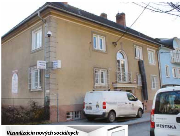
Vizualizácia nových sociálnych zariadení MsP Púchov.

Obnova sociálnych zariadení je prvým projektom riešeným ako „in-house“ zákazka medzi mestom Púchov a mestskou spoločnosťou Púchov servis. Ide o zákazku s peňažným plnením medzi dvoma verejnými obstarávateľmi, pokiaľ sú splnené určité podmienky. Mesto od „in-house“ zákaziek očakáva využitie kapacít mestských spoločností a úsporu finančných prostriedkov.