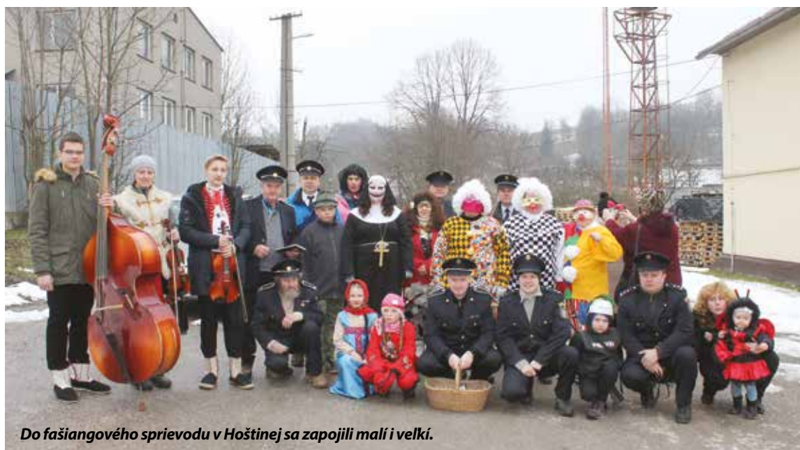
Do fašiangového sprievodu v Hoštine sa zapojili malí i veľkí.