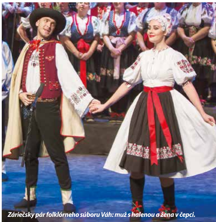
Záriečsky pár folklórneho súboru Váh: muž s halenou a žena v čepci.

Primárnym cieľom OZ Folklórne srdce Púchov je materiálna a finančná podpora mestských folklórnych súborov pracujúcich pri púchovskom divadle, ktoré dohromady počítajú 130 členov. Darované dve percentá idú predovšetkým na výrobu krojov, tanečnú a tréningovú obuv, tiež na potrebné spolufinancovanie projektov, akými sú napríklad dotácie Trenčianskeho samosprávneho kraja alebo Fondu na podporu umenia.