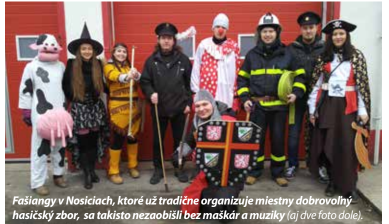
Fašiangy v Nosiciach, ktoré už tradične organizuje miestny dobrovoľný hasičský zbor, sa takisto nezaobišli bez maškár a muziky (aj dve foto dole).