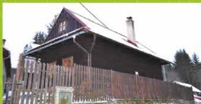
Predaj Drevenica, Papradno, zas. p. 72m 2 , pozemok 249m 2 cena 42 000 €