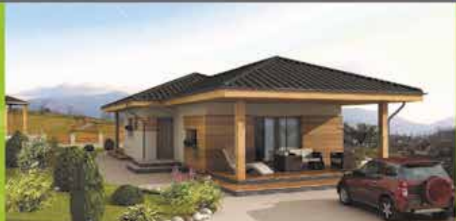
Murovaný dom i8 na klúč, zastavaná plocha 130 m 2 Cena 87.400,- €