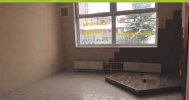
Predaj Komerčný priestor, Púchov, Moyzesová ul. 50m 2 , cena 59 900 €