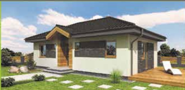
Murovaný dom i6 na klúč, zastavaná plocha 94 m 2 Cena 77.500,- €

VÝSTAVBA RD NA KLÚČ Moravská 1881, Púchov mob: 0905 795 637 koreny@i-house.sk www.i-house.sk