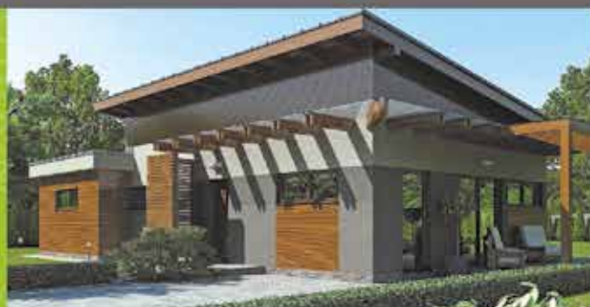
Predaj RD, Nové Nosice, zast. plocha 105m 2 , pozemok 870m 2 cena 132 500 €