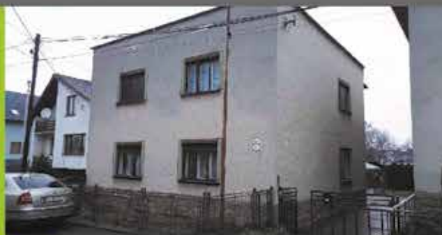
Predaj RD, Beluša, podl. plocha 150m 2 , pozemok 1218m 2 cena 109 000 €

REALITNÁ KANCELÁRIA Moravská 1881, Púchov mob: 0905 795 637 koreny@i-reality.sk www.i-reality.sk