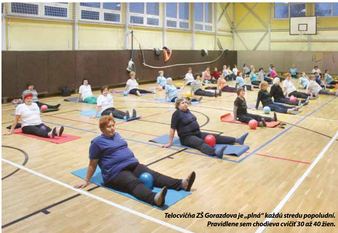
Telocvičňa ZŠ Gorazdova je „plná“ každú stredu popoludní. Pravidlene sem chodievajú cvičiť 30 až 40 žien.