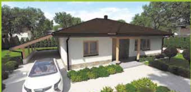
!#$%&#()*+..(na klúč, zastavaná plocha 157 m 2 Cena 109.500,- €