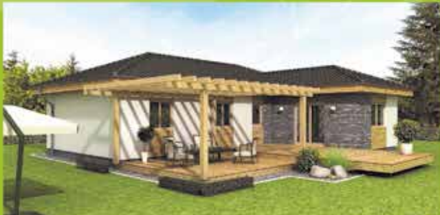
Montovaný dom i5 na klúč, zastavaná plocha 124 m 2 Cena 87.900,- €