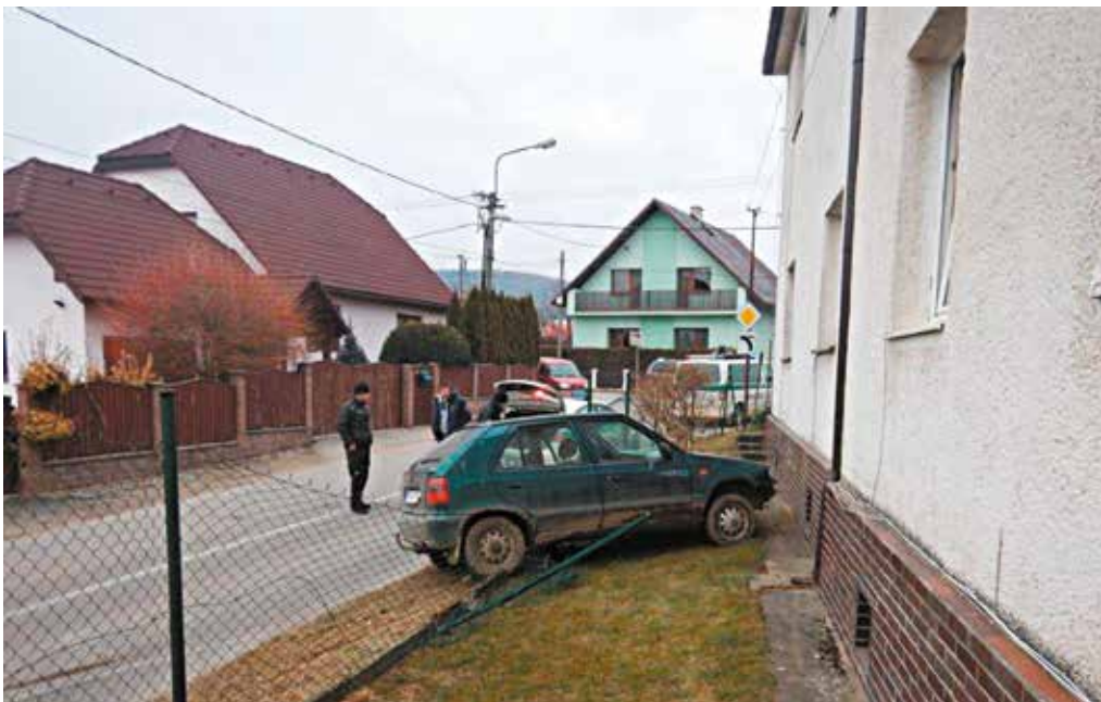
Mladík si v Lednických Rovniach poriadne zavaril. Za jazdu pod vplyvom alkoholu v čase zákazu mu hrozí až dvojročné väzenie.

Krátko po 22.00 hodine privolali hliadku mestskej polície na Okružnú ulicu, kde mal vzbudzovať verejné pohoršenie neznámy muž. Hliadka na mieste našla evidentne opitého pomočeného muža, ktorý sa váfal po zemi. Mestskí policajti ho previezli do miesta bydliska, kde si ho prevzala matka. Priestupok proti všeobecne záväznému nariadeniu mesta Púchov bude mestská polícia riešiť.