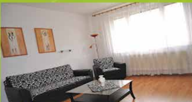
Predaj, 2-izbový byt 50 m 2 , Púchov, Rastislavova ul. cena 64 000 €