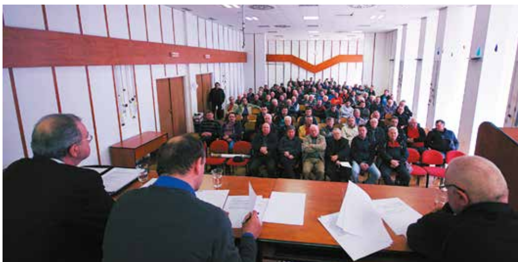
Výročná členská schôdza Miestnej organizácie Slovenského rybárskeho zväzu v Púchove rozhodovala v nedeľu o zložení výboru a kontrolnej komisie rybárskeho hnutia na najbližšie štyri roky.