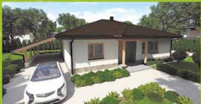
Montovaný dom i22 na klúč, zastavaná plocha 157 m 2 Cena 109.500,- €