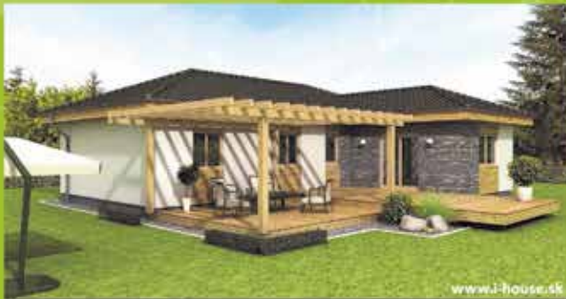
Montovaný dom i5 na klúč, zastavaná plocha 124 m 2 Cena 87.900,- €