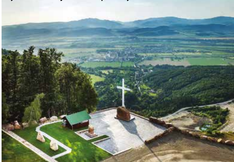
Výhľad z Butkova je vsutku imponantný.

V obklúčení vrchmi Strážovských vrchov nájdete maličkú obec Mojtiň, kde sa nachádza slovenský unikát – Mojtińska jaskyňa (590 m). Je v podstate jediným jaskynným kostolom na Slovensku. „Vrcholmi tohto ročníka nie sú len vysoké kopce či hrady, ale aj viaceré zaujímavé miesta. Unikátna je napríklad Mojtińska jaskyňa, ktorá má ako jediná na Slovensku oltár. Konajú sa v nej