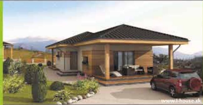
Murovaný dom i8 na klúč, zastavaná plocha 130 m 2 Cena 87.400,- €