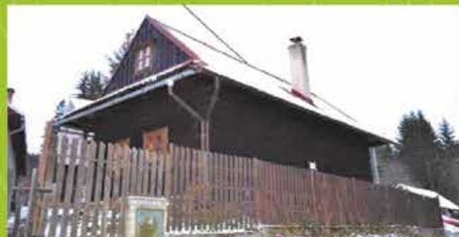
Predaj Drevenica, Papradno, zas. p. 72m 2 , pozemok 249m 2 cena 42 000 €