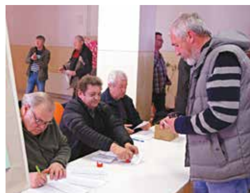
Voľby v plnom prúde. Každý listok bol evidovaný...