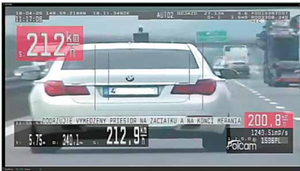
Vodič na D1 sa „chcel iba trochu ponaháňať“... Stálo ho to 800 eur.

Z celkového počtu ochorení bolo 380 ochorení na chrípku. V porovnaní s predchádzajúcim týždňom klesla chrípková chorobnosť o 30,9 percenta. Pre chrípku nemuseli prerušiť vyučovanie v žiadnej škole a školskom zariadení v Púchovskom okrese. (r)