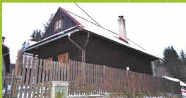
Predaj Drevenica, Papradno, zas. p. 72m 2 , pozemok 249m 2 cena 42 000 €