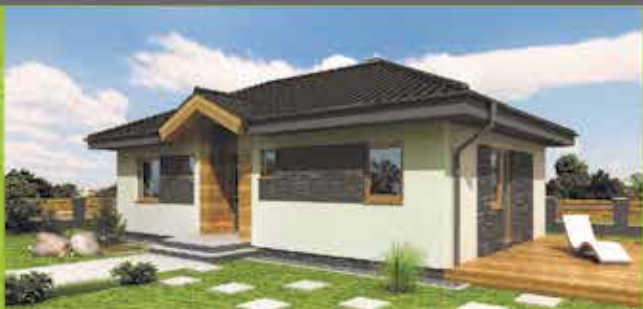
Murovaný dom i6 na kľúč, zastavaná plocha 94 m 2 Cena 77.500,- €

VÝSTAVBA RD NA KLÚČ Moravská 1881, Púchov mob: 0905 795 637 koreny@i-house.sk www.i-house.sk