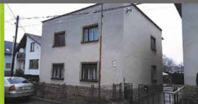
Predaj RD, Beluša, podl. plocha 150m 2 , pozemok 1218m 2 cena 109 000 €

REALITNÁ KANCELÁRIA Moravská 1881, Púchov mob: 0905 795 637 koreny@i-reality.sk www.i-reality.sk