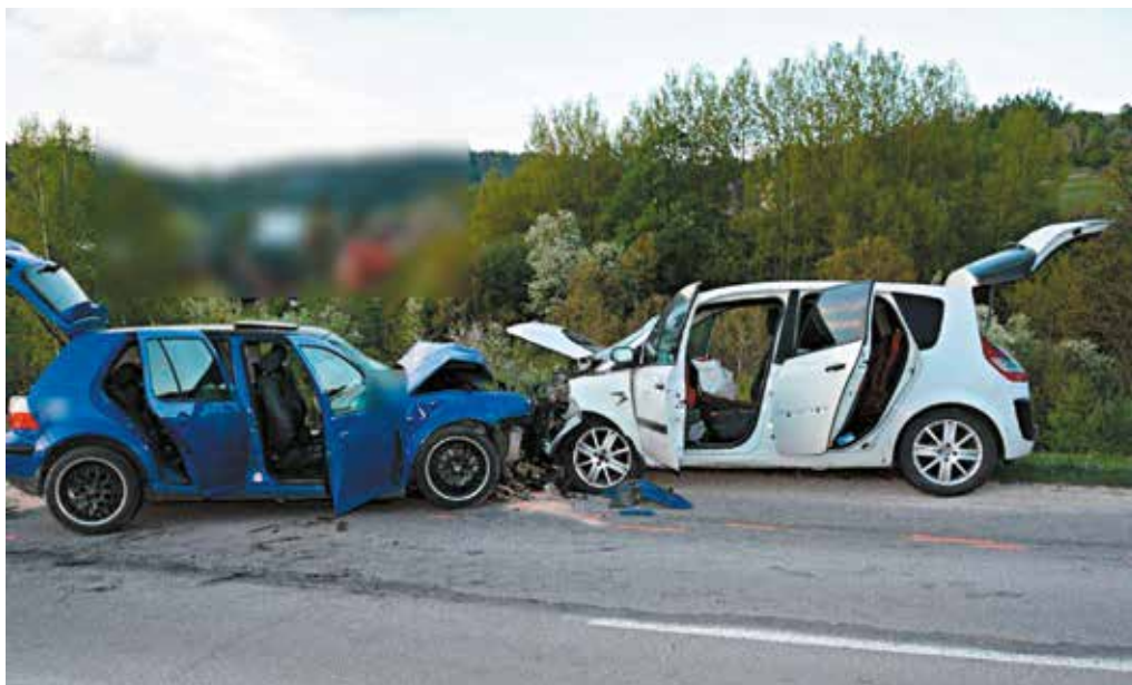
Nepozornosť na cestách má svoje tragické dôsledky. Napriek tomu, že na Slovensku je tento rok menej obetí.

Hliadka mestskej polície zasahovala na základe telefonického oznámenia na Holého ulici v Horných Kočkovciach, kde sa podľa oznámenia pohybovala žena, ktorá obťažovala okoloidúcich. Mestskí policajti na mieste našli ženu z Okružnej ulice v Púchove, ktorú poznali. Následne ženu z miesta vykázali.