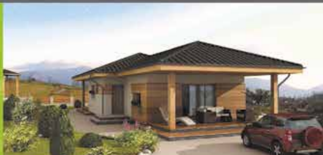
Murovaný dom i8 na kľúč, zastavaná plocha 130 m 2 Cena 87.400,- €