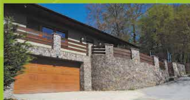
Predaj RD, Púchov, podl. plocha 240 m 2 , pozemok 1200 m 2 cena 299 000 €