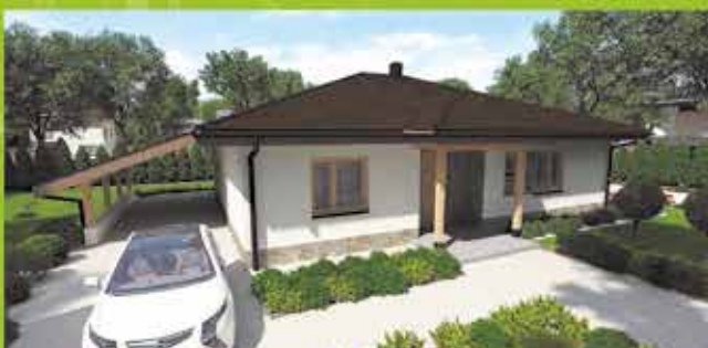
Montovaný dom i22 na kľúč, zastavaná plocha 157 m 2 Cena 109.500,- €