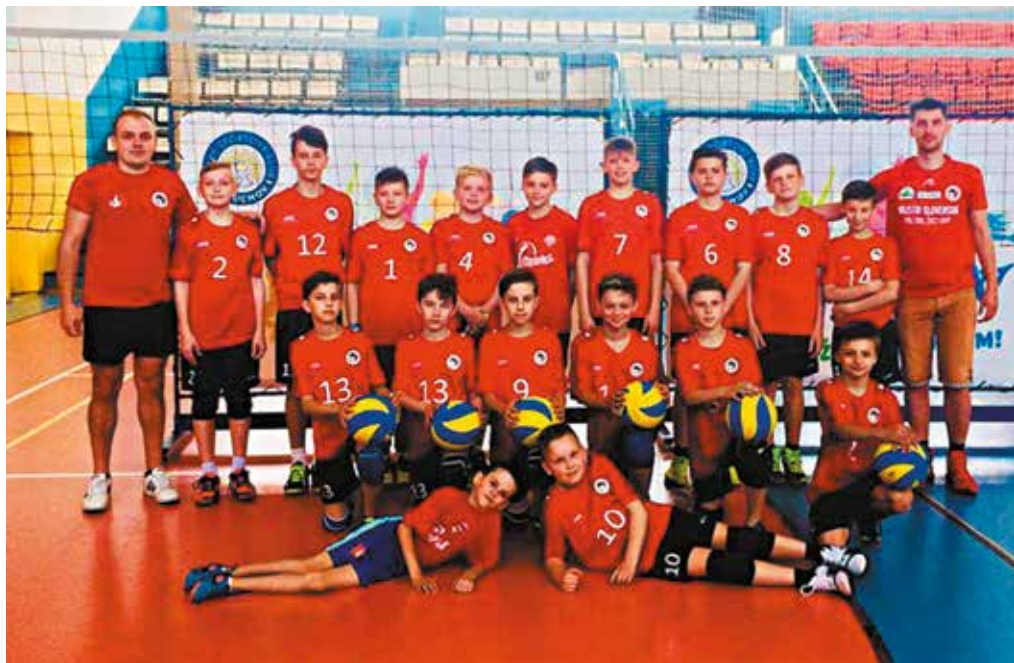
Mladší žiaci VO 1970 MŠK Púchov U13 si vybojovali postup na majstrovstvá Slovenska.