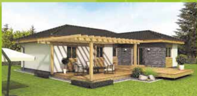
Montovaný dom i5 na kľúč, zastavaná plocha 124 m 2 Cena 87.900,- €