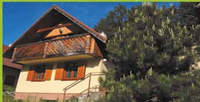
Predaj Chalupa, Čertov, podl.plocha 70m 2 , pozemok 298 m 2 cena 99 000 €