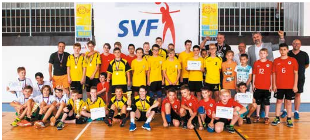
Kvarteto najlepších z majstrovstiev Slovenska škôl v Mini volejbale mladších žiakov v Trenčíne. Púchovčania napokon na medailu nesiahli, skončili štvrtí.