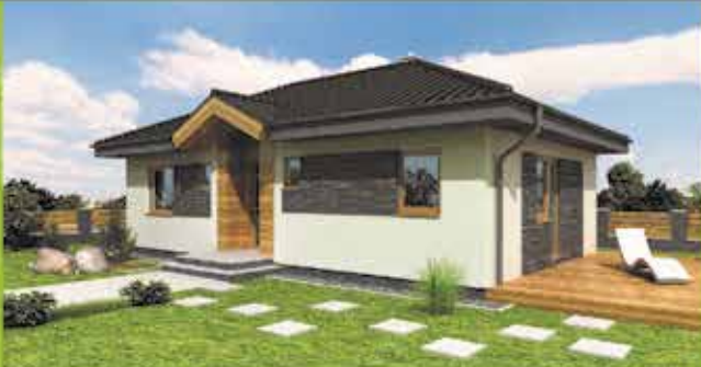
Murovaný dom i6 na klúč, zastavaná plocha 94 m 2 Cena 77.500,- €

VÝSTAVBA RD NA KLÚČ Moravská 1881, Púchov mob: 0905 795 637 koreny@i-house.sk www.i-house.sk