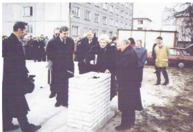
Začiatok II. etapy výstavby „Vzdelávacieho areálu Kolonka“ 21. 11. 1997 sa začala realizovať výstavba budovy laboratórií FPT v Púchove s rozpočtovým nákladom 70 mil. slovenských korún.

Veľkú pozornosť venuje tiež podpore mladých ľudí, ktorí majú záujem o kvalitné štúdium. V týchto dňoch preto založil pod svojim menom Nadáciu na podporu nadaných študentov na Fakulte priemyselných technológií v Púchove, s finančným vkladom 10000 Eur. Nadácia bude slúžiť na podporu a rozvoj talentu nadaných študentov s vynikajúcimi výsledkami štúdia na fakulte.