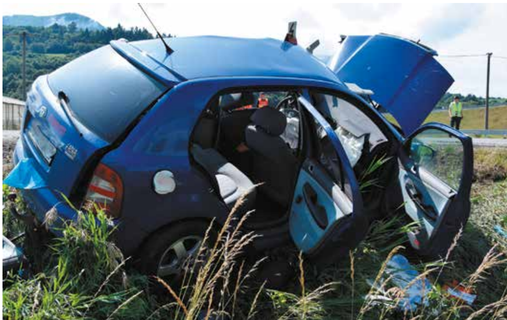
Ilustračná snímka KR HaZZ Trenčín

Hliadka mestskej polície preverovala telefonické oznámenie, podľa ktorého na Dvoroch spadol neznámy muž na cestu. Mestskí policajti na mieste zistili, že ide o Púchovčana z Moravskej ulice. Muž bol evidentne pod vplyvom alkoholu a krvácal v oblasti tváre. Privolaná posádka rýchlej záchrannnej pomoci previezla muža na ošetrovanie do nemocnice v Považskej Bystrici.