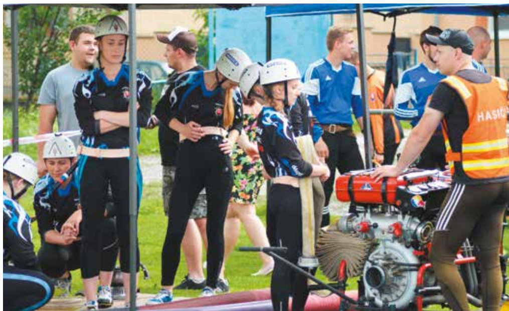
Po zlyhaní v úvodnom kole v Krásne dokázali žabky z Nosíc v Lehote pod Vtáčnikom triumfovať.