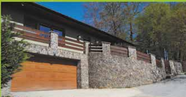
Predaj RD, Púchov, podl.plocha 240 m 2 , pozemok 1200 m 2 cena 280 000 €