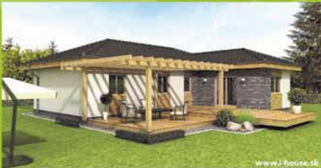
Montovaný dom i5 na klúč, zastavaná plocha 124 m 2 Cena 87.900,- €