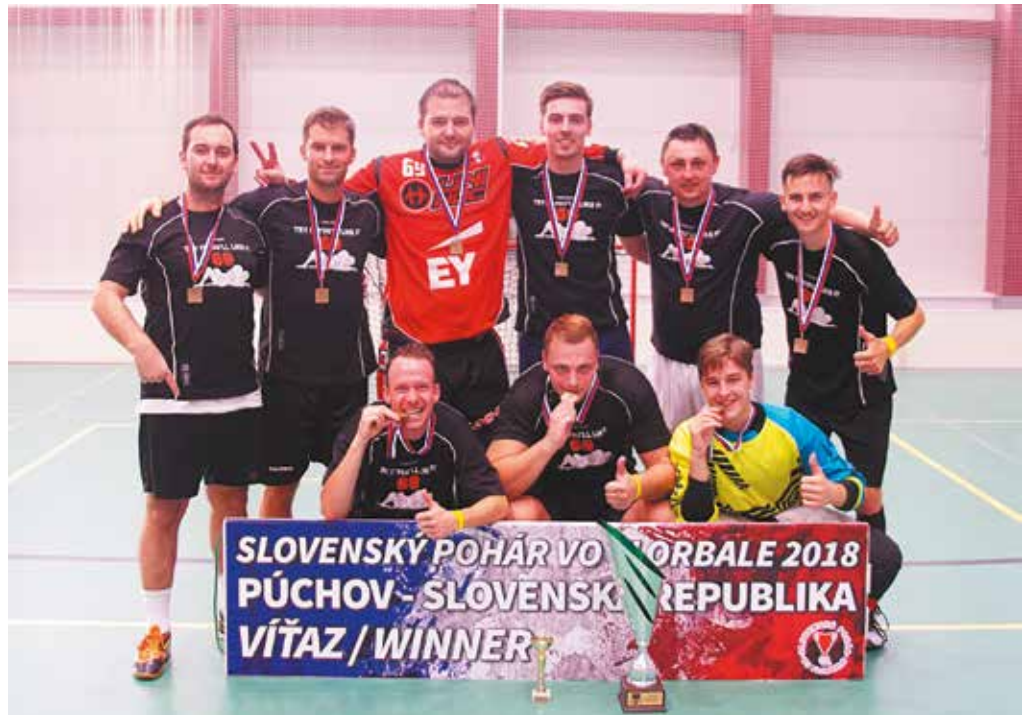
Zmiešané československé mužstvo Club 69 triumfovalo v púchovskej STC aréne v jubilejnom desiatom ročníku Slovenského pohára vo florbale.

Štvrtfinále: Ice Players Sereď – Légia Vlára 6:4, Si-