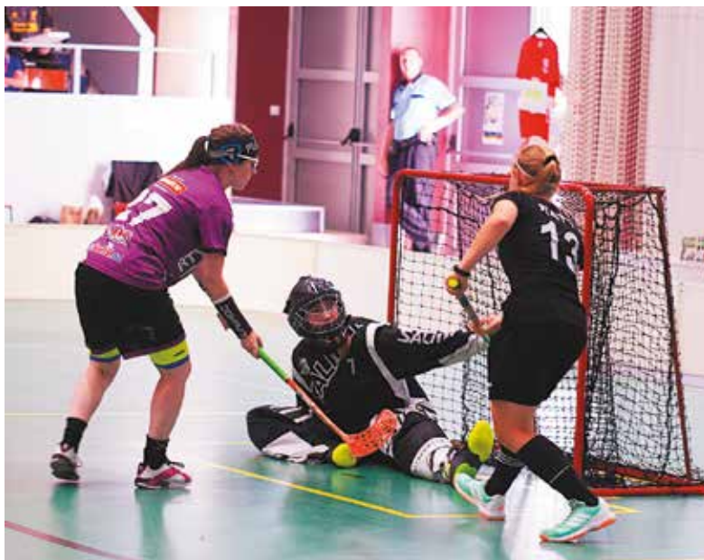
Finále ženskej súťaže prinieslo výborný florbal, z víťazstva sa napokon tešili dievčatá Pretty Women.