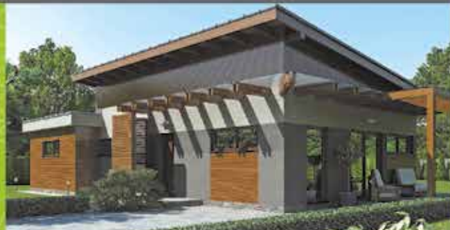
Predaj RD, Nové Nosice, zast. plocha 105m 2 , pozemok 870m 2 cena 132 500 €