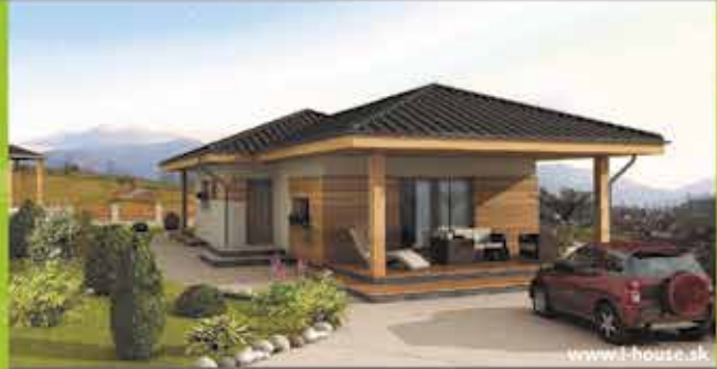
Murovaný dom i8 na klúč, zastavaná plocha 130 m 2 Cena 87.400,- €