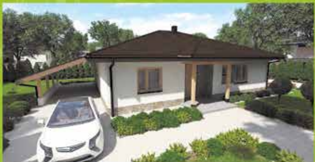
Montovaný dom i22 na klúč, zastavaná plocha 157 m 2 Cena 109.500,- €