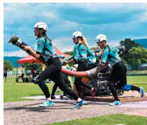
Ihřištanky skončili v Brumove štvrté a klesli na celkovo tretiu priečku.