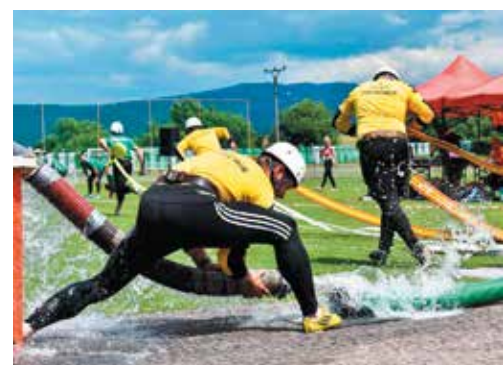
Podhorania obsadili v Brumove až ôsmu priečku a prišli o priebežné vedenie v SMHL.