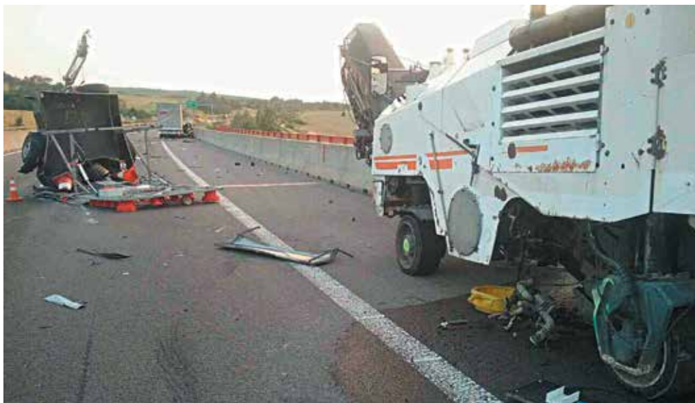
Nepozorný vodič na diaľnici D1 narazil do vozíka so šípkou a poškodil pritom aj stroj údržby diaľnic.