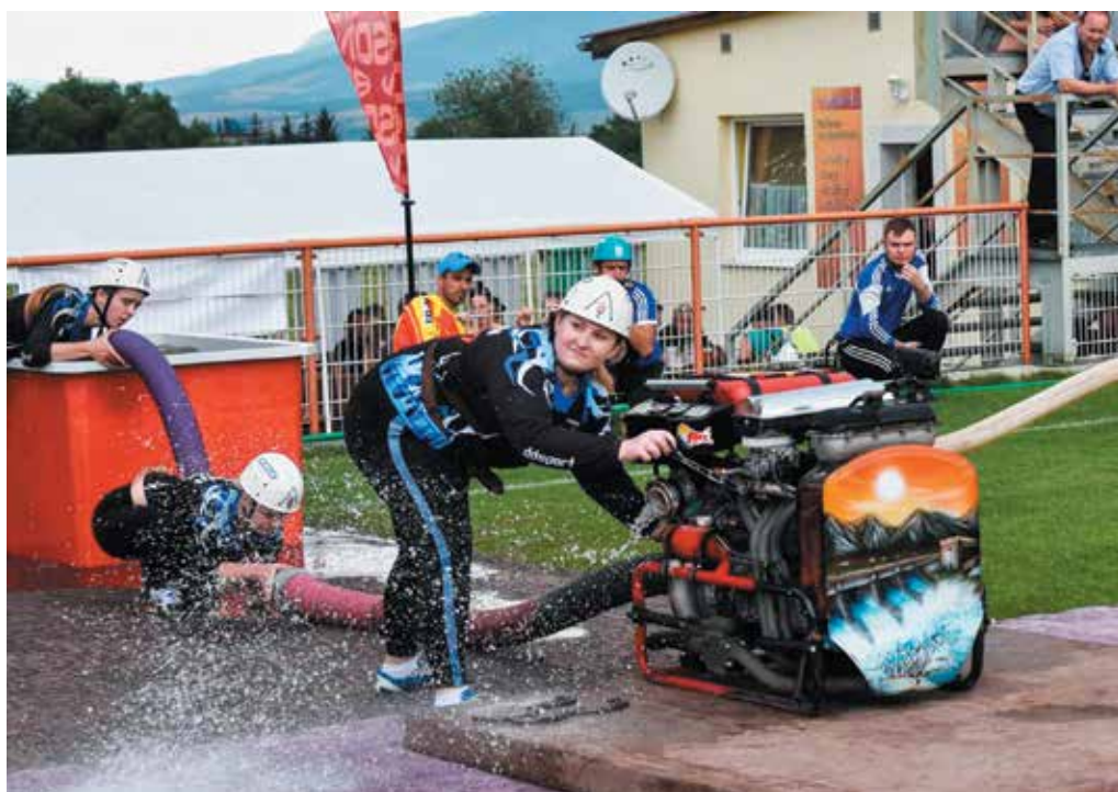
Dobrovoľné hasičky z Nosíc triumfovali v tretom kole Slovensko-moravskej hasičskej ligy v Brumove a v čele seriálu si vytvorili štvorbodový náskok pred dievčatami z Kvašova.