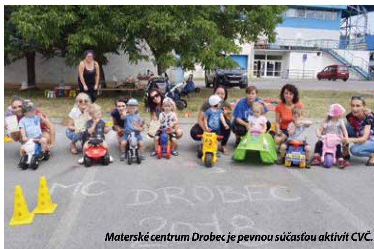
Materské centrum Drobec je pevnou súčasťou aktivít CVČ.