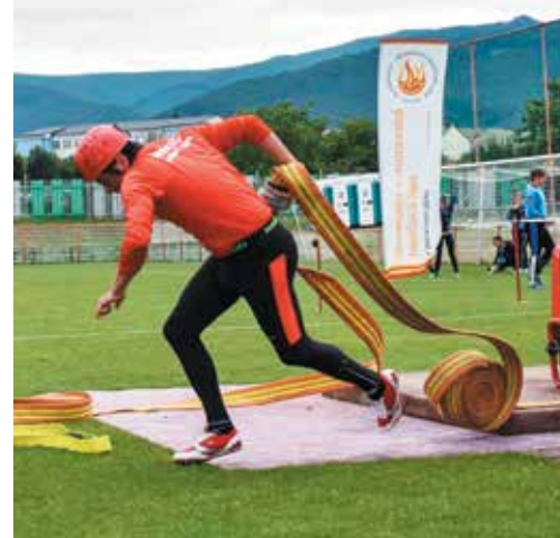
Doteraz asi najpríjemnejšie prekvapenie mužskej časti SMHL - hasiči z Lednických Rovní sú priebežne štvrtí.