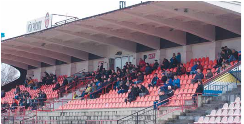
Jedným z cieľov vedenia MŠK Púchov je pritiahnúť na tribúny viac divákov...

- Žiacke mužstvá urobili zjavný progres. Pred dvomi-tromi rokmi sme boli v tabuľke na samom chvoste tabuľiek. Dnes sa všetky mužstvá pohybujú cca niekde v strede. Práve zápasy so Slovanom, Trnavou, Nitrou, či Dunajskou Stredou nám nastavujú zrkadlo, že sa musíme stále zlepšovať a byť konkurencie schopný najlepším na Slovensku. Dôležitejšie je, že v