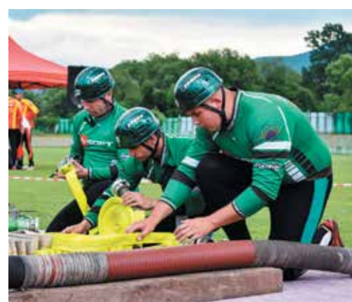
Dobrovoľní hasiči zo Zbory si po tretom kole seriálu SMHL držia priebežnú piatu priečku.