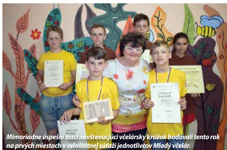
Mimoriadne úspešní žiaci navštevujúci včelársky krúžok bodovali tento rok na prvých miestach v celoštátnej súťaži jednotlivcov Mladý včelár.