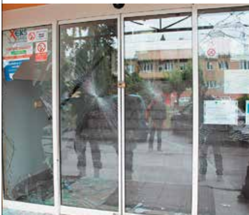
Podozrenie z vlámania do budovy OÚ sa napokon nepotvrdilo.