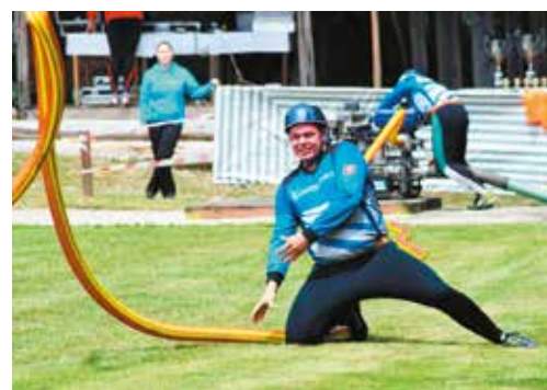
Muži Ihrište neboli s deviatou priečkou na domácej dráhe spokojní...