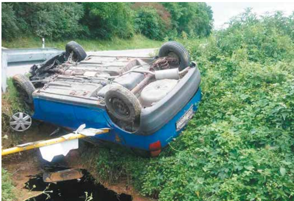
Únava či nepozornosť za volantom môže mať aj takéto následky.

Ráno o piatej oznámila na oddelenie mestskej polície žena z Ulice 1.mája, že pred jej vchodom stojí veľký túlavý pes a ona nemôže ísť vyvenčiť svojho psa. Hliadka na mieste psa veľkého v- zrastu odchytila a umiestnila do záchytného koterca v areáli Podniku technických služieb mesta Púchov. Majiteľ z Hrabovky si psa prevzal, vyriešili ho blo- kovou pokutou 10 eur.