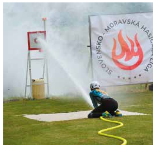
Ihrištanky skončili na domácom podujatí druhé. Horšie to bolo o týždeň vo Visolajoch...