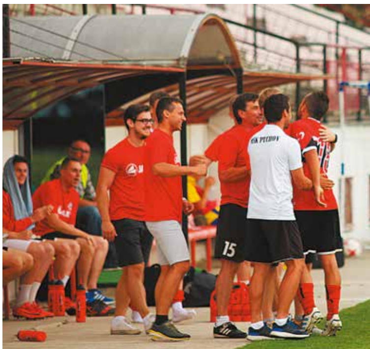
Radost na Púchovskej lavičke po góle do siete rezervy Dunajskej Stredy