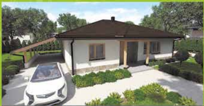
Montovaný dom i22 na klúč, zastavaná plocha 157 m 2 Cena 109.500,- €