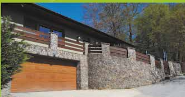
Predaj RD, Púchov, podl.plocha 240 m 2 , pozemok 1200 m 2 cena 280 000 €