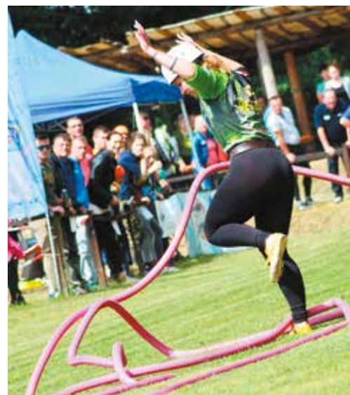
Tanec medzi hadicami... Nie oslavný, dievčatám z Dežeríc sa v tejto sezóne nedarí.