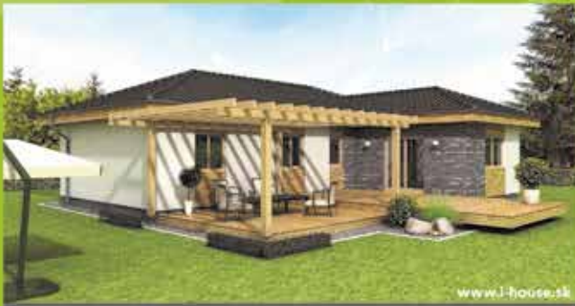
Montovaný dom i5 na klúč, zastavaná plocha 124 m 2 Cena 87.900,- €