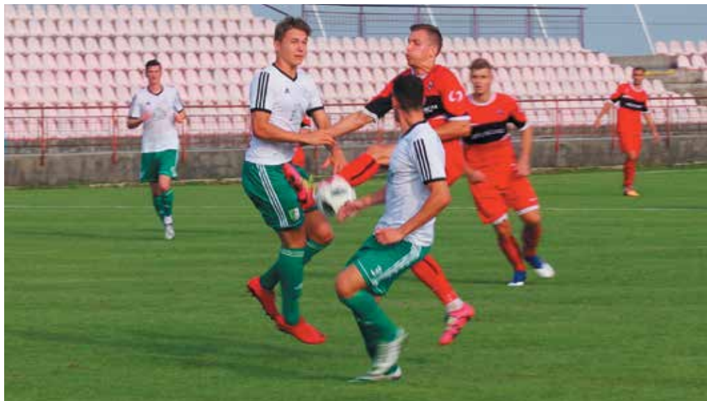
Po bezgólovej remíze doma s Novým Mestom nad Váhom (na snímke) nedokázali Púchovčania skórovať ani v dvoch posledných stretnutiach v Považskej Bystrici a v Šali.