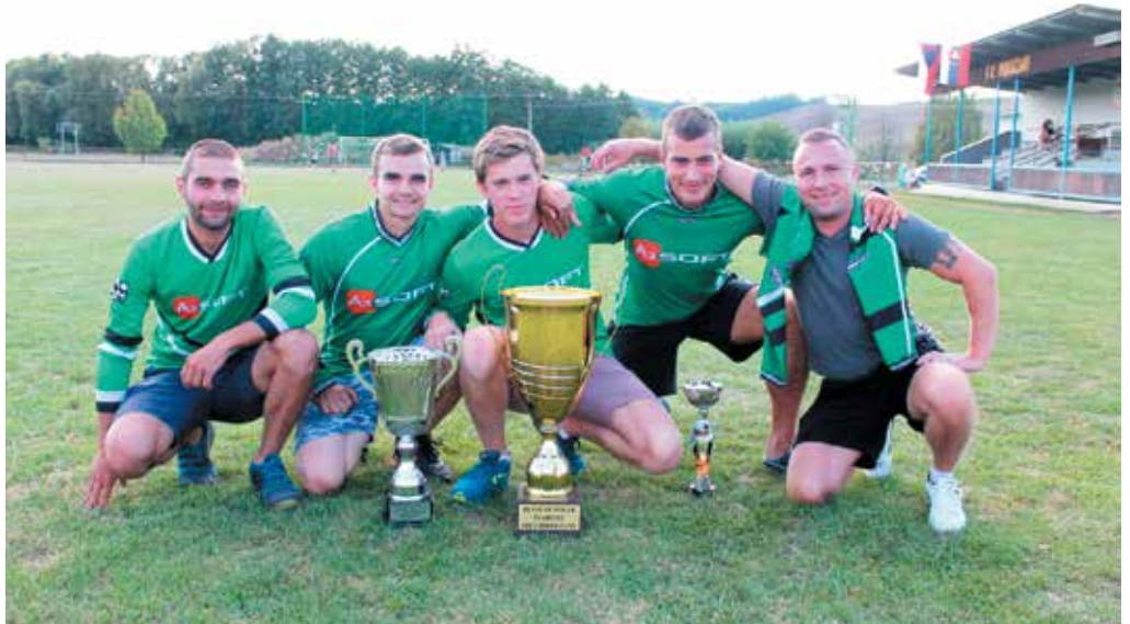
Muži Zboru mali výbornú druhú polovicu SMHL. Po víťazstve v Podlužanoch si brúsili zuby na čelnú priečku. Dvaťnásťte miesto v Priedhorí a diskvalifikácia v Trstí ich však odsúdili na boj o tretie miesto.

Hliadka mestskej polície zasahovala na Komenškého ulici, kde z bytu na 12.poschodí hlasno vykrikovala žena. Keďže vykrikovať neprestala ani po príchode hliadky mestskej polície, predviedli ženu krátko pred druhou hodinou nadránom na oddelenie mestskej polície. Žena sa dopustila priestupku proti všeobecne záväznému nariadeniu mesta. Policianti priestupok vyriešili napomenutím, ženu previezli do miesta bydliska, kde si ju prevzal syn.