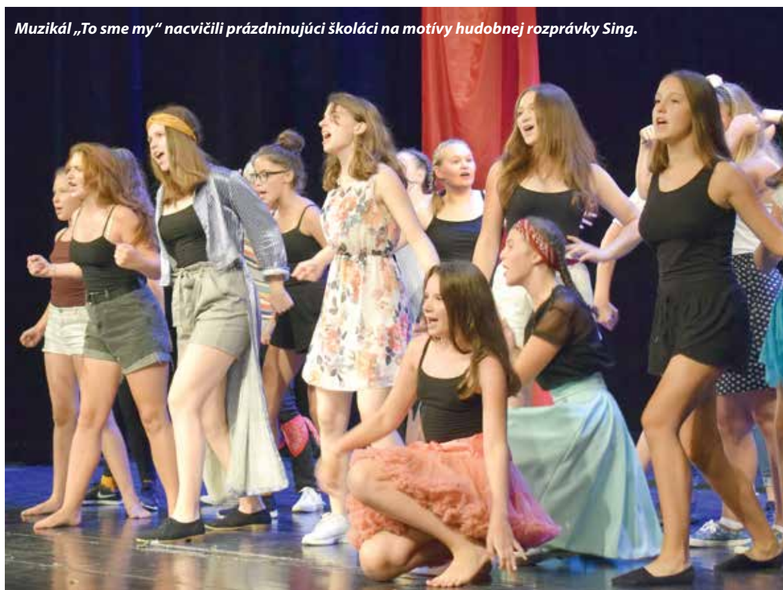
Muzikál „To sme my“ nacvičili prázdninujúci školáci na motívy hudobnej rozprávky Sing.