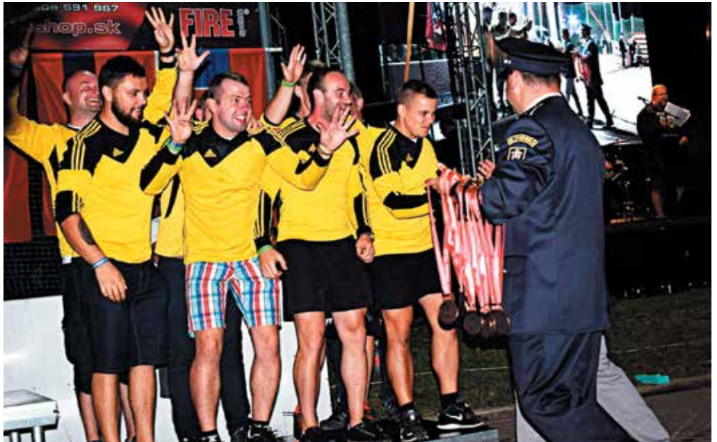
Aj z celkového tretieho miesta mali napokon Podhorania radosť.

postavili dobrovoľní hasiči z Brumova. Ich víťazstvo je úplne zaslúžené. S výnimkou prvých dvoch kôl, kedy raz útok nedokončili a raz skončili v poli porazených, neskončili ani raz horšie ako na piatom mieste. Štyri víťazstvá, dve druhé miesta a trikrát umiestnenie na tretej priečke ich posunuli do čela seriálu, ktorý napokon vyhrali s takmer štyridsaťbodovým náskokom pred Stupným a takmer 60-bodovým náskokom pred obhajcom minuloročného prvenstva z Podhoria. Podhoranov nezastihol uplynulý ročník v optimálnej forme. Pripísali si na svoje konto iba dve víťazstvá a tri druhé miesta, čo je na lepšie ako tretie miesto málo. Aj o stupienok víťazov sa napokon triasli do poslednej chvíle, v záverečnom podujatí v Ďurdovom totiž opäť útok nezvládli útok svojich predstáv a to, že skončili napokon bronzový je aj výsledkom rovnako pokazeného útoku Zbory. Zbora bola príjemným prekvapením tohto ročníka,