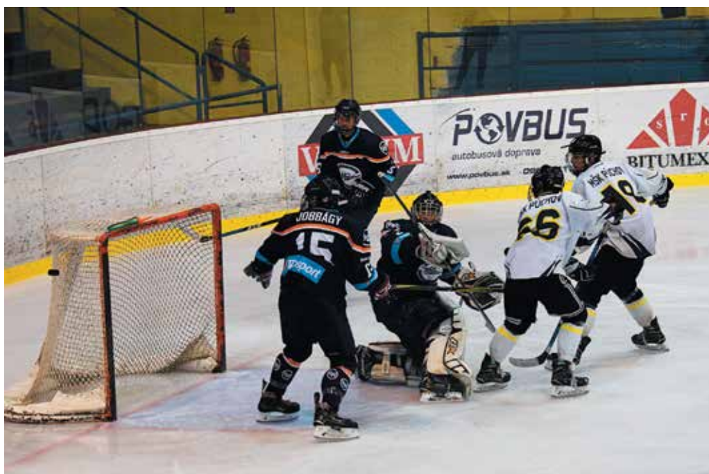
Začiatok sezóny zastihol vo výbornej forme extraligových dorastencov MŠK Púchov. Doma si poradili v predohrávke aj s favorizovanými Košicami a okupujú horné poschodie tabuľky.

Slovan Bratislava – Banská Bystrica 5:1, Michalovce – Liptovský Mikuláš 2:6, Martin – Skalica 3:5, Zvolen – Košice 0:7, Trenčín – Spišská Nová Ves 7:0, Poprad