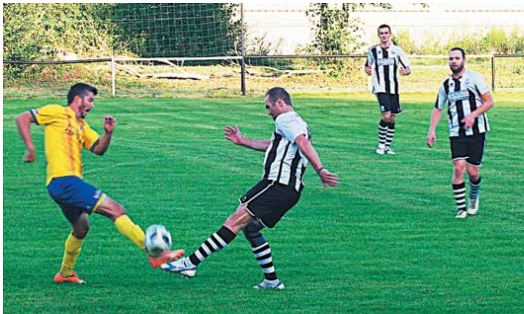
Streženičiam (v bielo-čiernom) sa v nedeľu do cesty postavil Bolešov. Na súpera recept nenašli a odišli bez bodu.