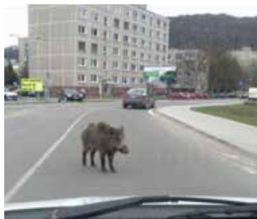
Staršia fotografia (r. 2012) diviaka na Okružnej ulici.

„Keby išlo o bezprostredné ohrozenie životov, zvieru by sme hneď odstrelili my. V tomto konkrétnom prípade hliadka mestskej polície po lokalizovaní zvieratá zabezpečovala