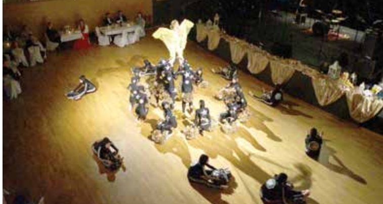
Na parkete sú juniorské mažoretky súboru Nelly, majsterky Slovenska a vicemajsterky Európy, ktoré predvedli choreografiu „Vesmír“!