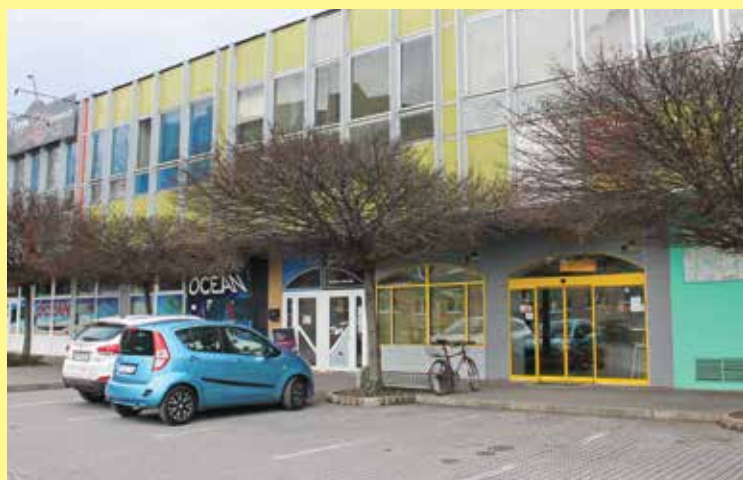
Sociálny „obchod“ Veci za úsmev funguje od roku 2017.

Zároveň mesto Púchov v súčasnosti podniká kroky, ktoré by mali viesť k rozšíreniu uvedených otváracích hodín. Sociálny obchod sa nachádza v budove SOV na Námestí slobody 1401 - druhé dvere vľavo od Kočkovskej pekárne. -tm-