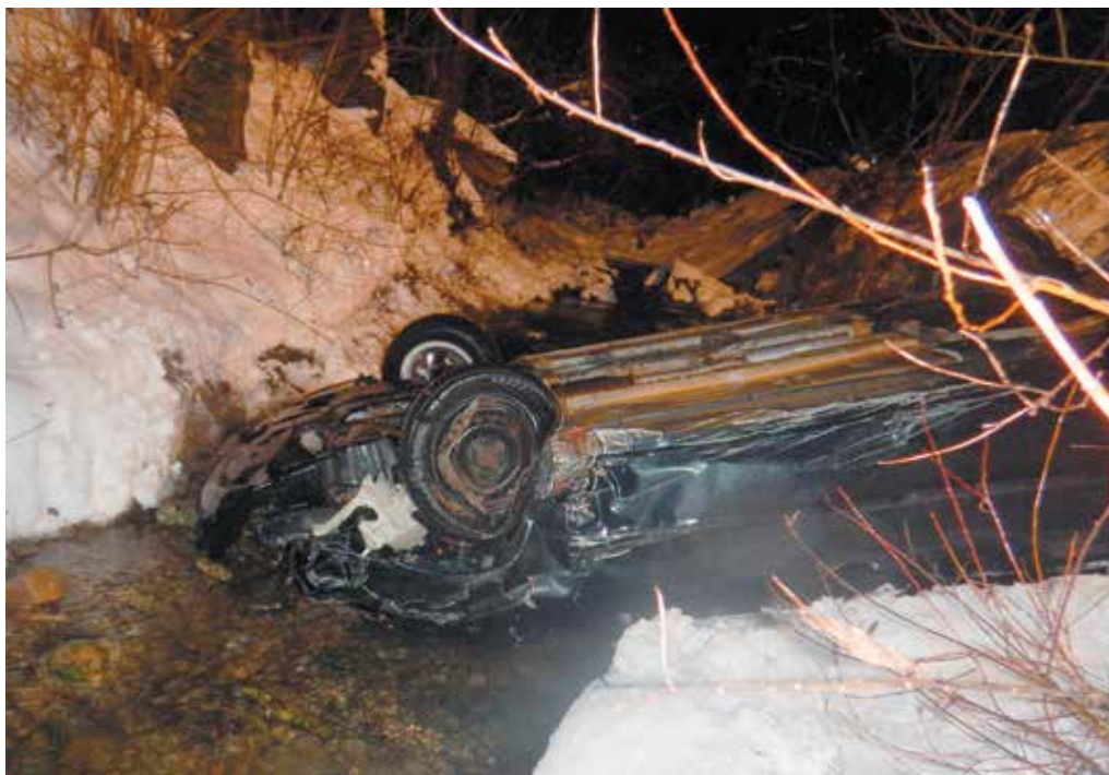
Pri nehode medzi Lednicou a Lednickými Rovňami sa ťažko zranila spolujazdkyňa.

Hliadka mestskej polície riešila telefonické oznámenie, podľa ktorého do dvora oznamovateľky vnikol susedov pes veľkého vzrastu. Pes bol pri dverách do dvora a žena sa obávala, aby ju nenapadol. Hliadka zistila, že majiteľka psa proti voľnému pohybu zabezpečila, hliadka priestupok proti všeobecne záväznému nariadeniu o chove psov vyriešila napomenutím. Majiteľka si svojho psa z dvora odvieďala.