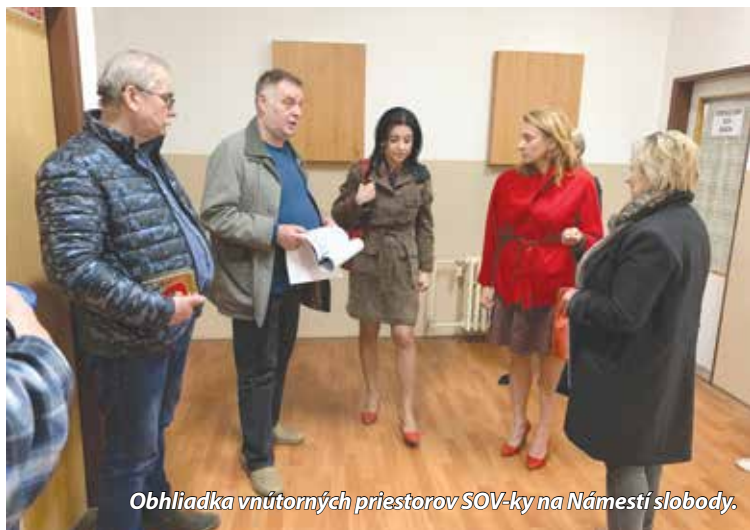
Obhliadka vnútorných priestorov SOV-ky na Námestí slobody.