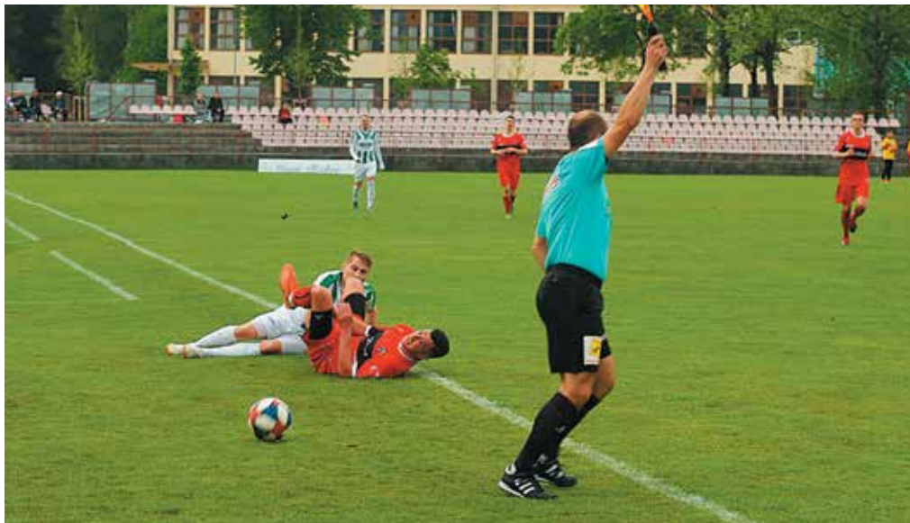
V súboji o špicu tabuľky sa nehralo v rukavičkách. Futbalisti Malženíc neraz vytiahli zákroky ohrozujúce zdravie futbalistov Púchova.