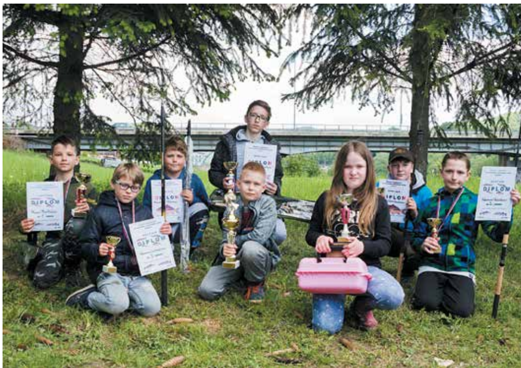
Najlepší mladí rybári z detských rybárskych pretekov v Púchove.

Z dispečingu Obvodného oddelenia Policajného zboru v Púchove požiadali hliadku mestskej polície o zásah proti mužovi, ktorý sa pohyboval v križovatke na Ulici F. Urbánka, kde vykrikoval a ohrozoval okoloidúcich ľudí i cestnú premávku. Muž z Dolných Kočkoviec bol zjavne pod vplyvom alkoholu, jeho otec, ktorého telefonicky privolali informoval, že býva agresívny a vyhráža sa zabitím sebe aj svojim blízkym. Otec privolal zdravotných záchranárov a žiadal prevezenie syna na psychiatrické vyšetrenie. Muž sa v prítomnosti hliadky odhaľoval a komunikoval zmätene. Privolaný lekár požiadal o sprievod hliadky štátnej polície. Muža previezli do považskobystrickej nemocnice.