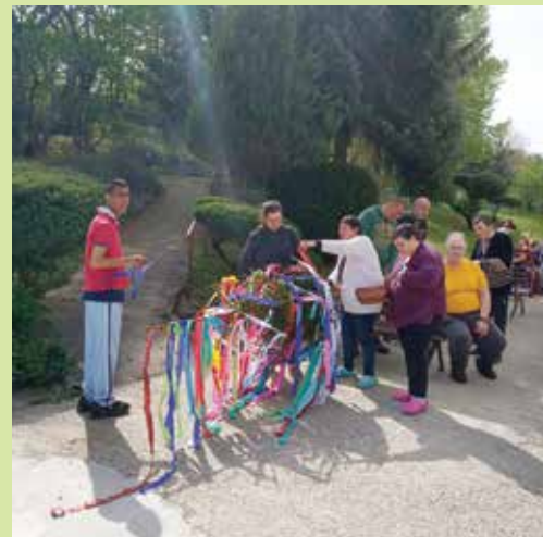
Šikovné klientky CSS Kolonka vyzdobili farebnými stužkami pripravený stromček, ktorý symbolizuje víťazstvo jari nad zimou.