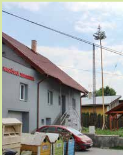
16-metrový máj, ktorý postavili členovia dobrovoľného hasičského zboru pred kultúrnym domom v Ihrišti.

V Púchove sa stavali máje na viacerých miestach. Redakcii Púchovských novín prišli fotografie z akcií v Ihrišti a centrách sociálnych služieb na Kolonke a Chmelinci.