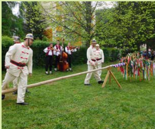
Ľudová hudba Váh sa postarala o dobrú náladu v CSS Chmelinca a dobrovoľní hasiči dohliadali na bezpečnosť pri stavaní mája.