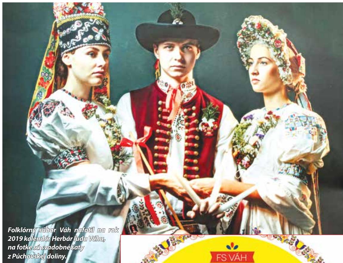
Folklórny súbor Váh nafotil na rok 2019 kalendár Herbár ľudu Váhu, na fotke sú svadobné šaty z Púchovskej doliny.

Už teraz vieme povedať, že nás čaká veľmi nabitá leto. Po štyroch rokoch sa opäť predstavíme na javisku najznámejšieho festivalu ľudovej hudby, spevu a tanca - Východná v piatok podvečer v rámci programového bloku s názvom „Z dolín Javorníkov“, kde budeme hrdó prezentovať dedičstvo