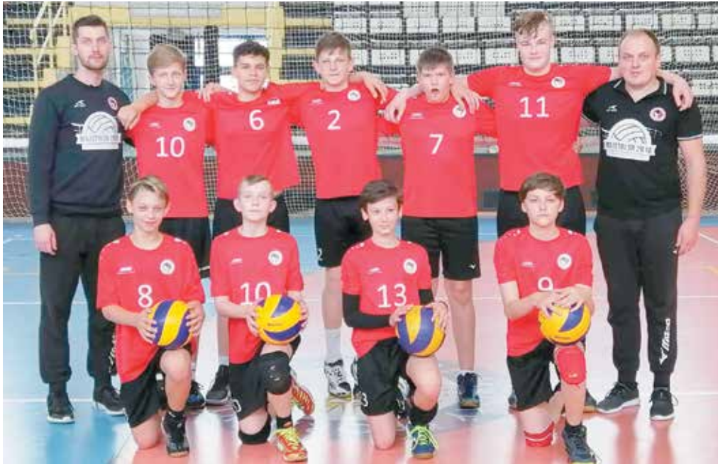
Mladí púchovskí volejbalisti postúpili na záverečný turnaj majstrovstiev Slovenska.