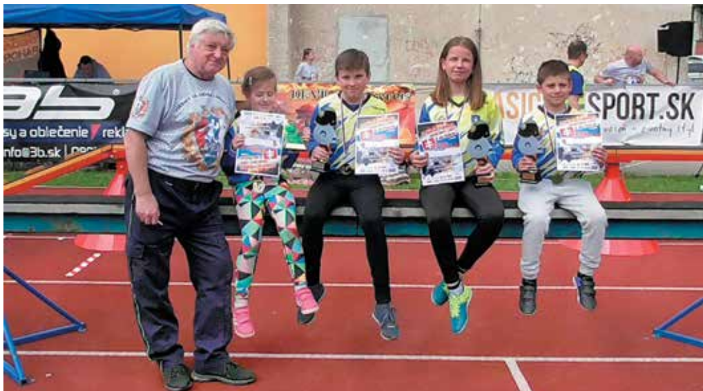
Na snímke úspešní mladí hasiči z Púchova so svojim „šéfom“.

K agresívnemu opitému mužovi v bare na Dvoroch privolali hliadku mestskej polície krátko pred deviatou večer. Muž sa správal agresívne aj voči hliadke a odmietol preukázať svoju totožnosť. Napriek výzve, aby upustil od protiprávneho konania muž kládol odpor, bol agresívny a arogantný. Hliadka preto použila donucovacie prostriedky – hmaty, chvaty a putá. Muža následne previezli na oddelenie mestskej polície na zistenie totožnosti. V dychu mu namerali takmer dve promile alkoholu. Muž sa dopustil priestupku proti verejnému poriadku, prípad je v riešení.