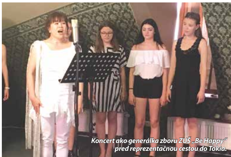
Koncert ako generálka zboru ZUŠ „Be Happy“ pred reprezentačnou cestou do Tokia.