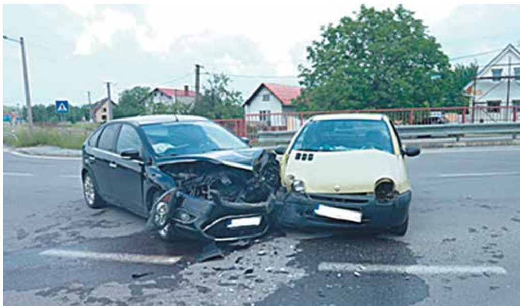
Púchovskí hasiči zasahovali minulý týždeň aj pri dopravnej nehode v Beluši.

Ako informovali Železnice Slovenskej republiky, v čase výluky bude vlaková doprava nahradená autobusovou dopravou. „ŽSR prosia cestujúcich o trpezlivosť a pochopenie v súvislosti s obmedzeniami v železničnej doprave, ku ktorým môže dochádzať v dôsledku výlukových prác a zároveň apelujú na zvýšenú pozornosť pri sledovaní vývesiek a hlásení staničného rozhlasu v železničných staniach,“ upozorňujú ŽSR. (r)