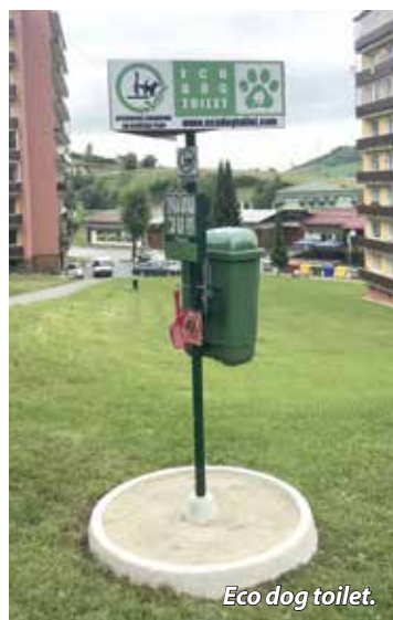
Eco dog toilet.

Primátorka novovymenovaným riaditeľom škôl zažehala do osobného i kariérneho života naplnenie všet-