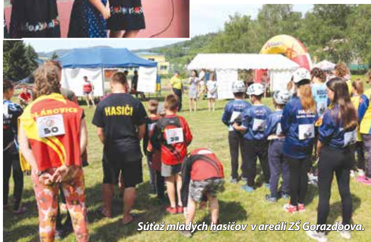
Súťaž mladých hasičov v areáli ZŠ Gorazdova.