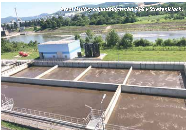
Areál čističky odpadových vôd PVS v Streženiciach.

overenie účtovnej závierky a výročnej správy spoločnosti tak, ako im to ukladá zákon o účtovníctve.