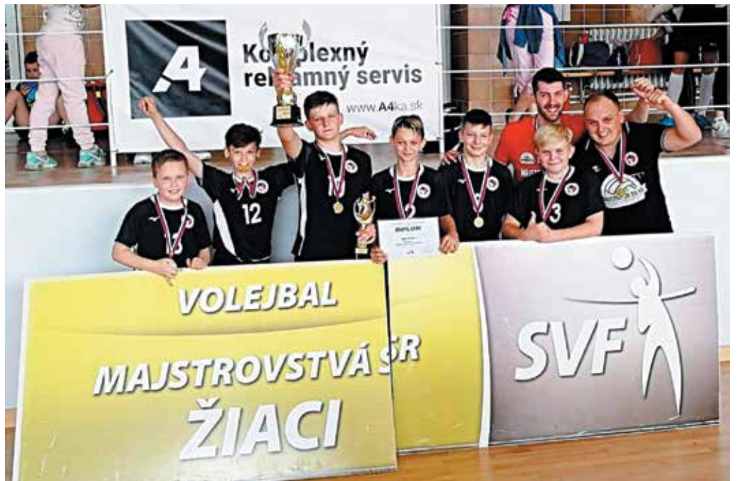
Mladší žiaci VO 1970 MŠK Púchov získali minulý víkend v Prešove titul majstrov Slovenska. Vo finálovom stretnutí dokázali otočiť už pomaly stratený zápas a tešili sa z titulu.

Druhý hrací deň odštartovali Púchovčania semifinálovým zápasom proti MVK Nové Mesto nad Váhom. Po suverénnom výkone si zabezpečili postup do finálového zápasu. V ňom nastúpili proti silnému mužstvu VK Junior 2012 Poprad. Po nezládnutej koncovke prvého setu prehrávali Púchovčania 0:1. Do druhého setu nastúpili volejbalisti Púchova viac koncentrovaní a nabudení a po výbornom výkone vyrovnali na 1:1. V rozhodujúcom sete prehrávali Púchovčania v tajbrejku už 7:11, po oddychovom čase sa však zázračne vzchopili, zvíťazili 15:13 a stali sa majstrami Slovenskej republiky.