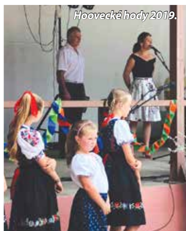
Hoovecké hody 2019.