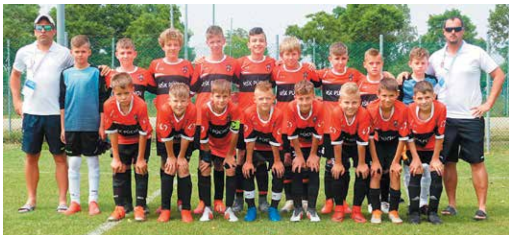
Mladší žiaci MŠK Púchov dosiahli na medzinárodnom turnaji v Rimini skvelý úspech.