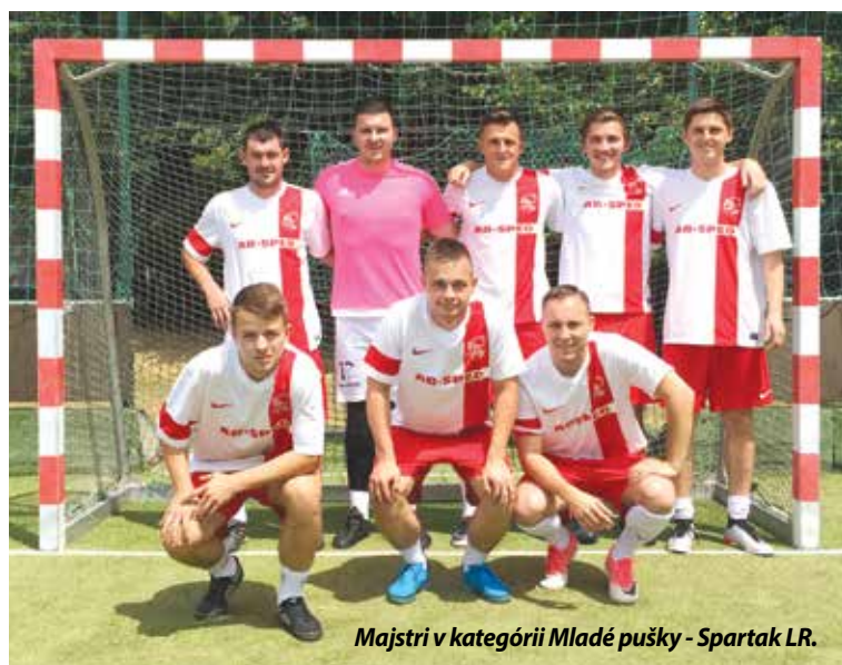
Majstri v kategórii Mladé pušky - Spartak LR.