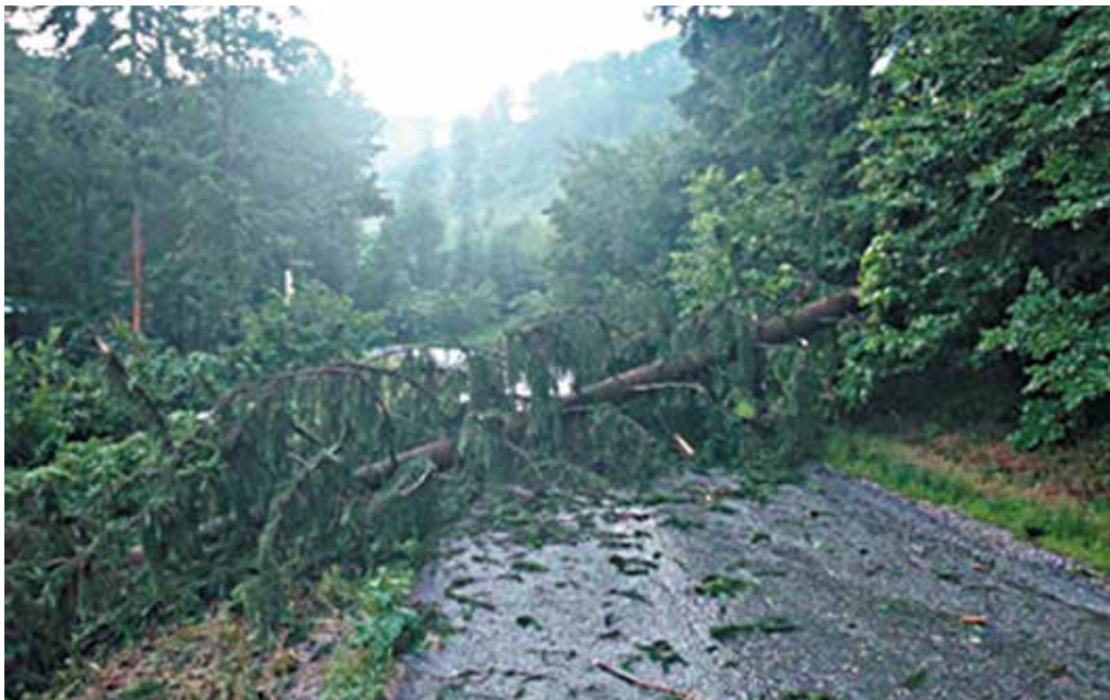
V piatok zamestnali púchovských hasičov stromy, ktoré popadali cestu v Lazoch pod Makytou.

Netradičný zásah absolvovali príslušníci púchovskej mestskej polície. Obyvateľ jednej z púchovských bytoviek telefonicky informoval, že v spoločných priestoroch bytovky lietajú vo vchode dve lastovičky, ktoré sa nevedia dostať von. Mestských policajtov požiadal, aby umožnili lastovičkám odlet na voľné priestranstvo. Hliadka pootvárala dvere a okná na schodišti a tým sa umožnil lastovičkám bezpečný odlet z priestorov schodišťa.