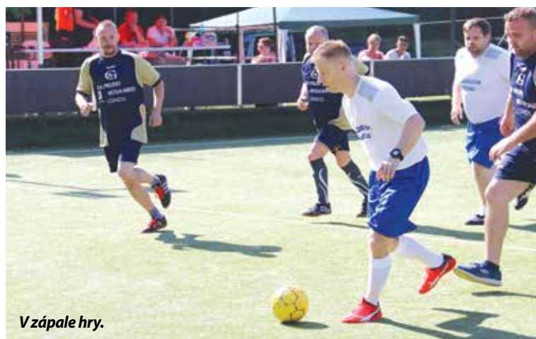
V zápale hry.