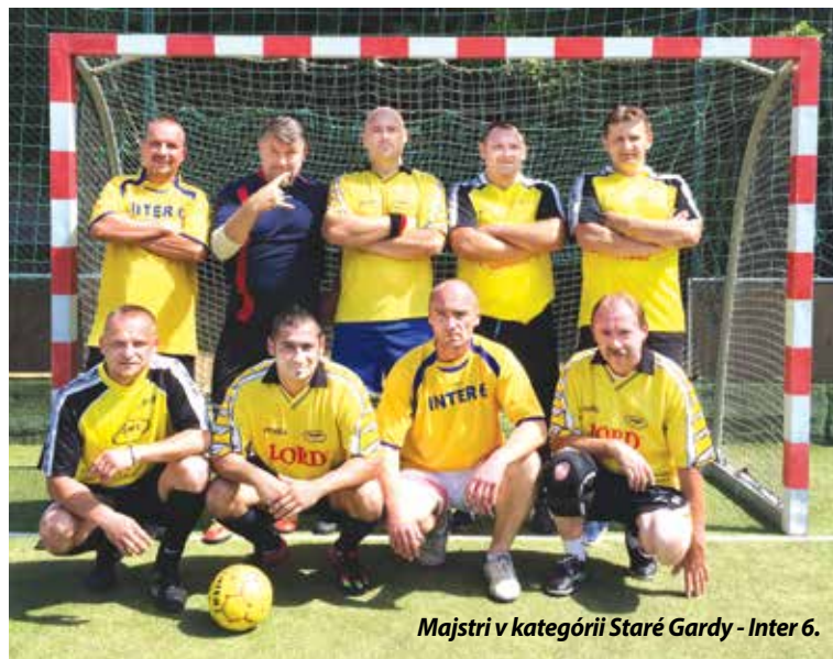
Majstri v kategórii Staré Gardy - Inter 6.