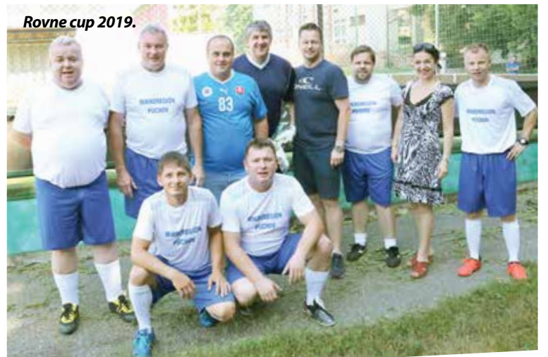
Rovne cup 2019.