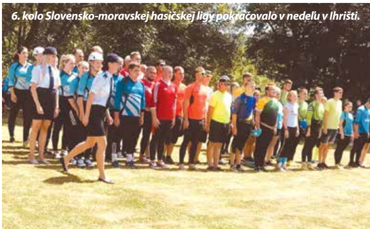
6. kolo Slovensko-moravskej hasičskej ligy pokračovalo v nedeľu v Ihršti.

sa v utorok 25. júna obrátila na prítomných jubilantov v sále divadla.