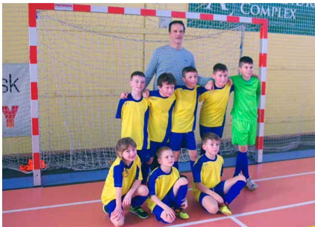
Futbalové talenty FC Púchov triumfovali v halovom futbalovom turnaji.