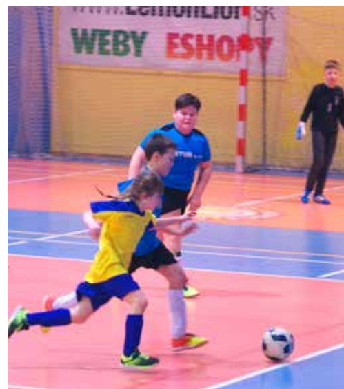
Dievčatá v súbojoch s chlapcami nie sú na halových turnajoch žiadnou novinkou.