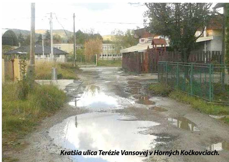
Kratšia ulica Terézie Vansovej v Horných Kočkovciach.