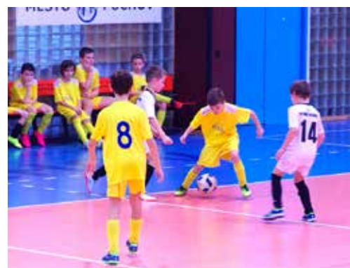
Lednické Rovne síce nezískali ani bod, ale hrou rozhodne nesklamali. Škoda nepremených šancí.