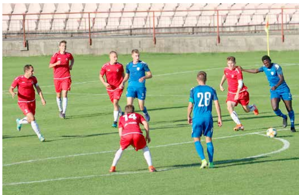
Už o necelé tri týždne vstúpia muži MŠK Púchov do odvetnej časti 2. futbalovej ligy. I napriek desiatemu miestu v tabuľke je pre manažment klubu prioritou záchrana v súťaži.