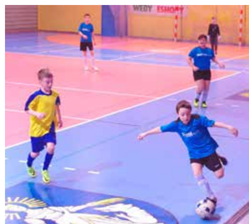
Záverečné stretnutie turnaja prinieslo drámu so šťastným koncom pre FC Púchov (v žltých dresoch). Belušania ich o prvenstvo nepripravili.

Všetko o oblastnom futbale: www.obfzpb.sk