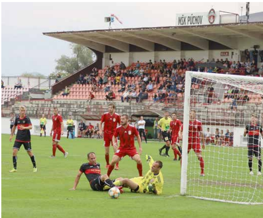
Po 56 dňoch opäť vybehnú v sobotu futbalisti MŠK Púchov (v čierno-červených dresoch) na domáci trávnik v majstrovskom stretnutí. Bohužiaľ, bez divákov...

Menej radosti z rozhodnutia krízového štábu a Slovenského futbalového zväzu majú futbaloví mládežníci. Dohrávanie mládežníckych súťaží nie je na programe dňa, a tak púchovskí starší i mladší dorastenci, rovnako ako všetky žiacke družstvá MŠK Púchov, zostanú už do konca roka bez súťažného futbalu.