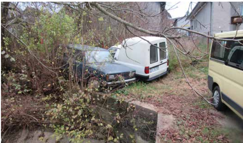
Z verejného priestoru v Záskalí si niekto urobil vrakovisko.

Hliadka mestskej polície zasahovala na základe telefonického oznámenia pred Základnou školou Komenského, kde sa mala zdržiavať hlučná mládež. Hliadka na mieste našla dve osoby, ktoré na verejnom priestranstve konzumovali alkoholické nápoje. Mestskí policajti vyriešili priestupok napomenutím a dvojicu z miesta vykazali.