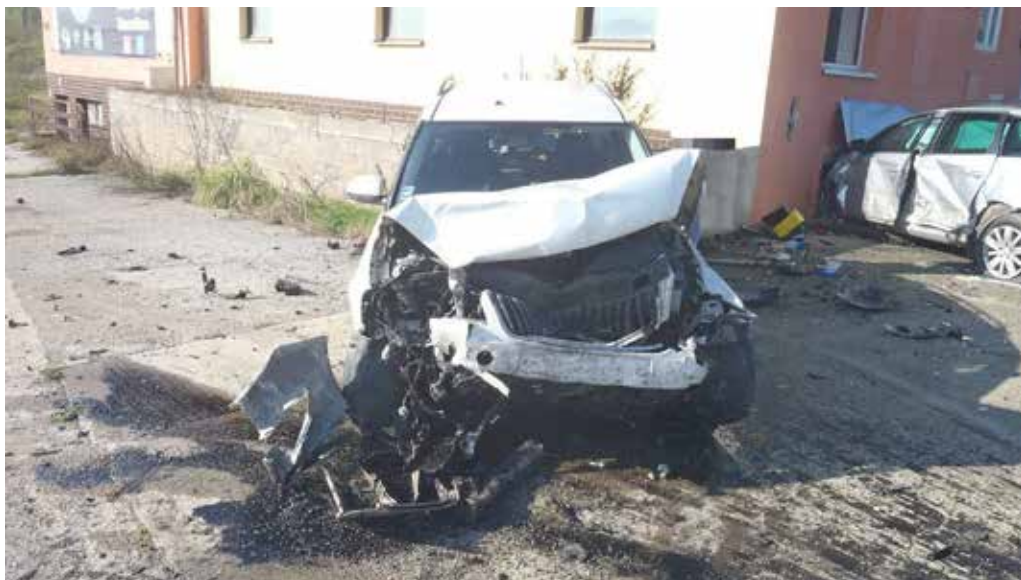
Do štatistiky dopravnej nehodovosti „prisepala“ aj táto nehoda 19. októbra v Beluši.

Alarmujúci trend požívania alkoholu pred jazdou sa potvrdil aj na krajskej úrovni. Kým v prvých desiatich mesiacoch minulého roku zavinili vodiči pod