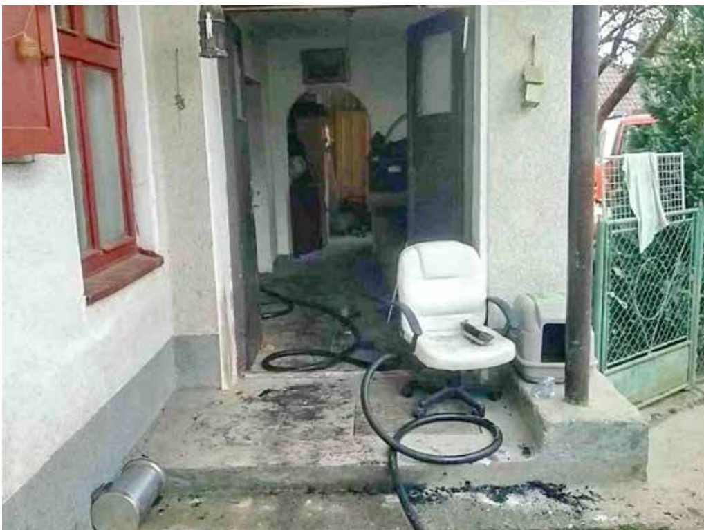
Pri tragickom požiari v Lednických Rovniach vyhasli dva ľudské životy. Polícia má podozrenie, že išlo o vraždu.