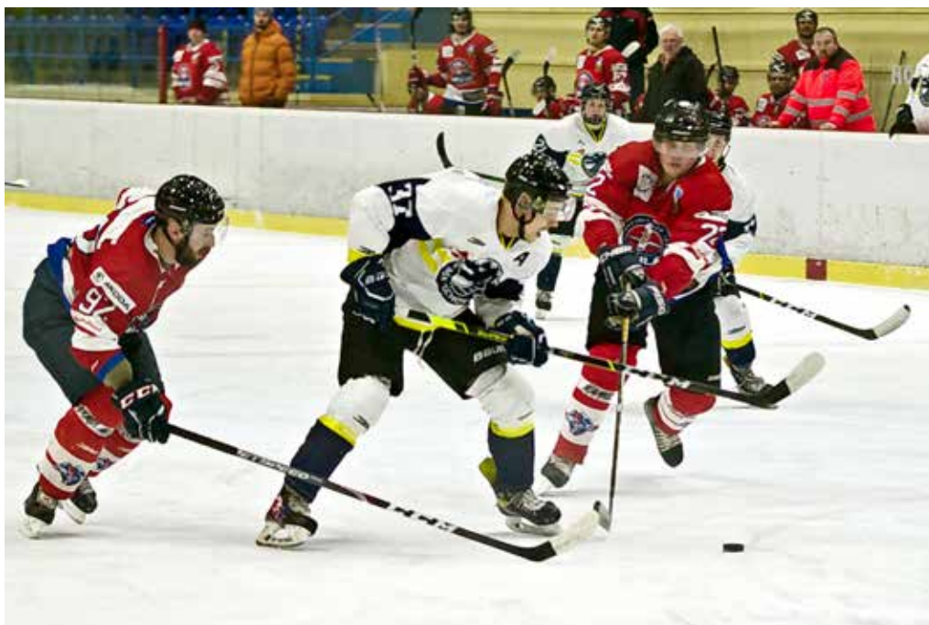
Po dvoch domácich víťazstvách nadelili muži Púchova v treťom stretnutí štvrtfinále Liptákom desiatku a postúpili do semifinále.