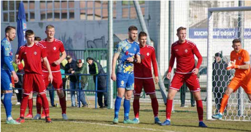
Futbalisti MŠK Púchov (v červenom) vyhrali minulý týždeň nečakane v Humennom. Dôležitý bodový zisk potvrdili domácim víťazstvom nad Rohožníkom.