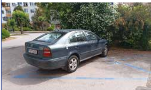
Vodiči v Púchove neprestávajú prekvapovať...