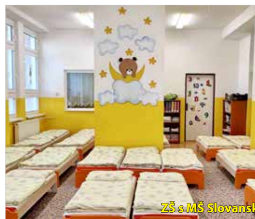
ZŠ s MŠ Slovanská