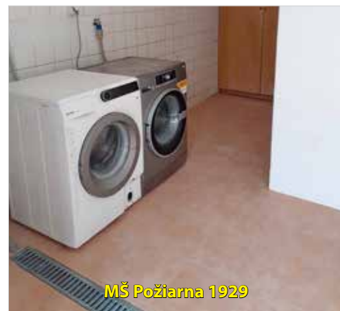
MŠ Požiarna 1929