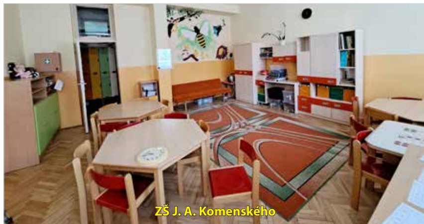
ZŠ J. A. Komenského

Oddelenie školstva a sociálnych vecí MsÚ