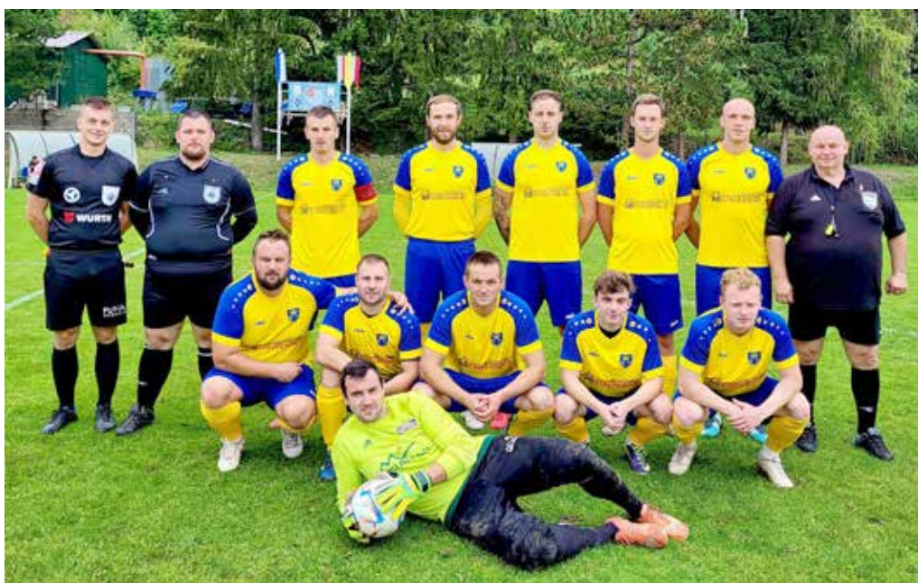
Futbalisti Lysej podávajú v tejto sezóne výborné výkony. Po šiestom kole im patrí bronzová priečka.