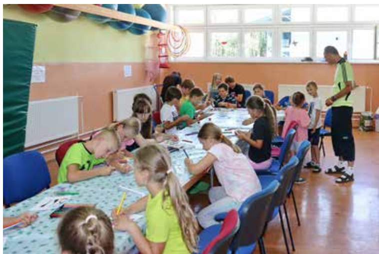
Tábor Mladý kozmonaut