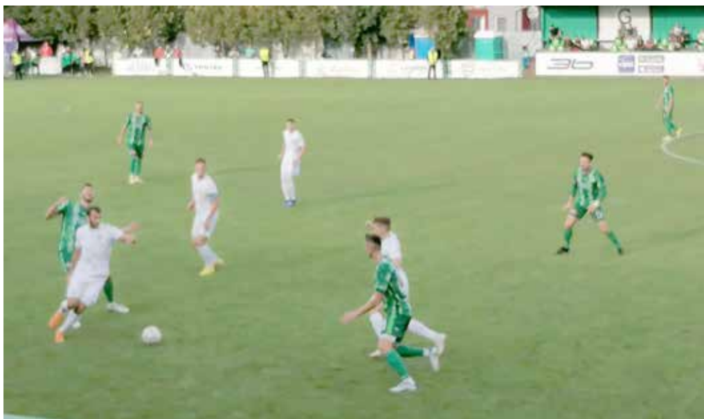
Futbalisti MŠK Púchov (v bielom) podľahli v Ličartovciach nováčikovi z Prešova a prišli o post lídra druholigovej tabulky. V piatok privítajú na domácom trávniku Pohronie.