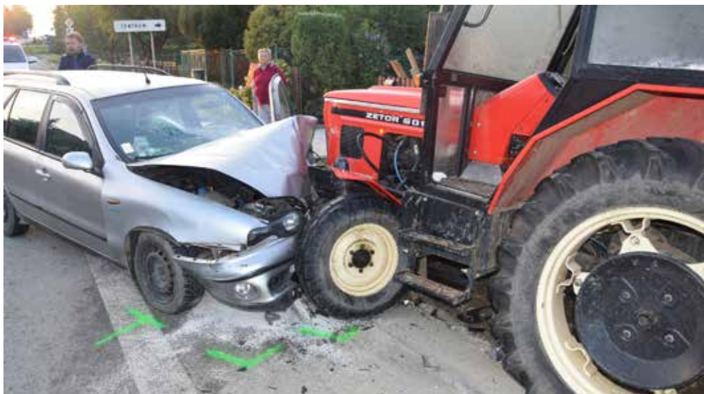
Hazard so životom sa 28-ročnej žene po tretikrát stal takmer osudným. Narazila do traktora a utrpela zranenia.