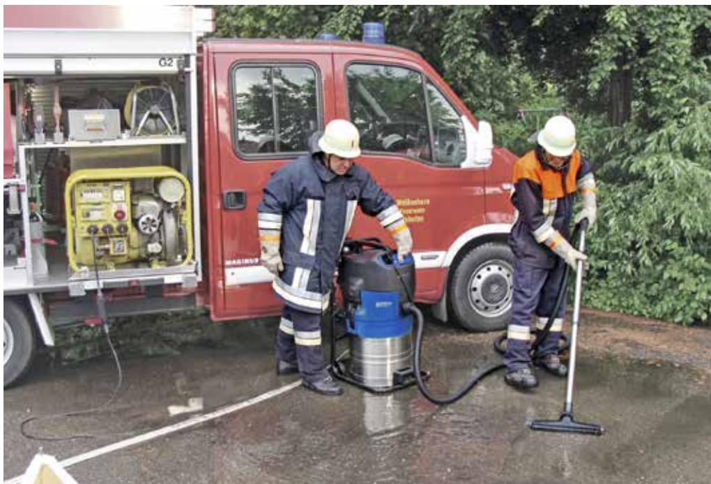
Púchovskí dobrovoľní hasiči využijú nový priemyselný vysávač po povodniach, pri odstraňovaní ropných škvŕn, či čistení priestorov po požiaroch.