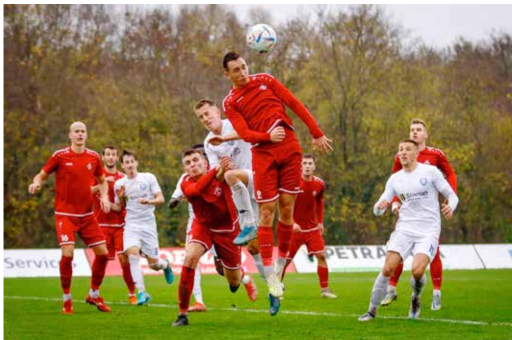
Futbalisti MŠK Púchov (v červenom) prehrali v osemfinále Slovenského pohára v Šamoríne až po penaltovom rozstrele.