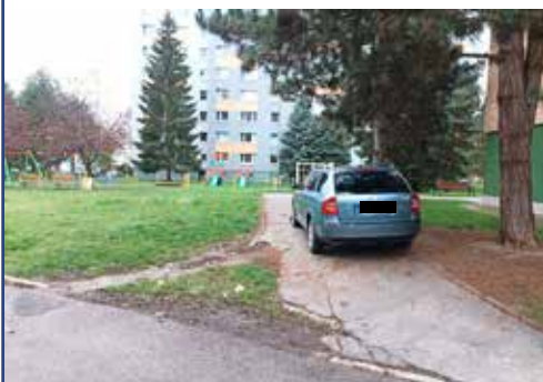
Aj v minulom týždni riešili mestskí policajti niekoľko desiatok priestupkov pri parkovaní vozidiel. FOTO: MsP Púchov

Na oddelenie mestskej polície prijali oznámenie, podľa ktorého na Moravskej ulici leží medzi autami neznámy muž. Okoloidúci sa ho snažili prebrať, no nedarilo sa im to. Hliadka našla na zemi sedieť muža z Púchova, krvácal z temena hlavy. Na zemi bola krvavá mláka. Muž najskôr rezolútne odmietal ošetrovanie, napokon však po príchode jeho manželky a zdravotných záchranárov súhlasil s prevozom do považskobystrickej nemocnice. Predtým, ako ho odviezla sanitka ešte informoval, že mu zmizla peňaženka. Mestskí policajti prehľadali okolie, peňaženku však nenašli. MsP Púchov