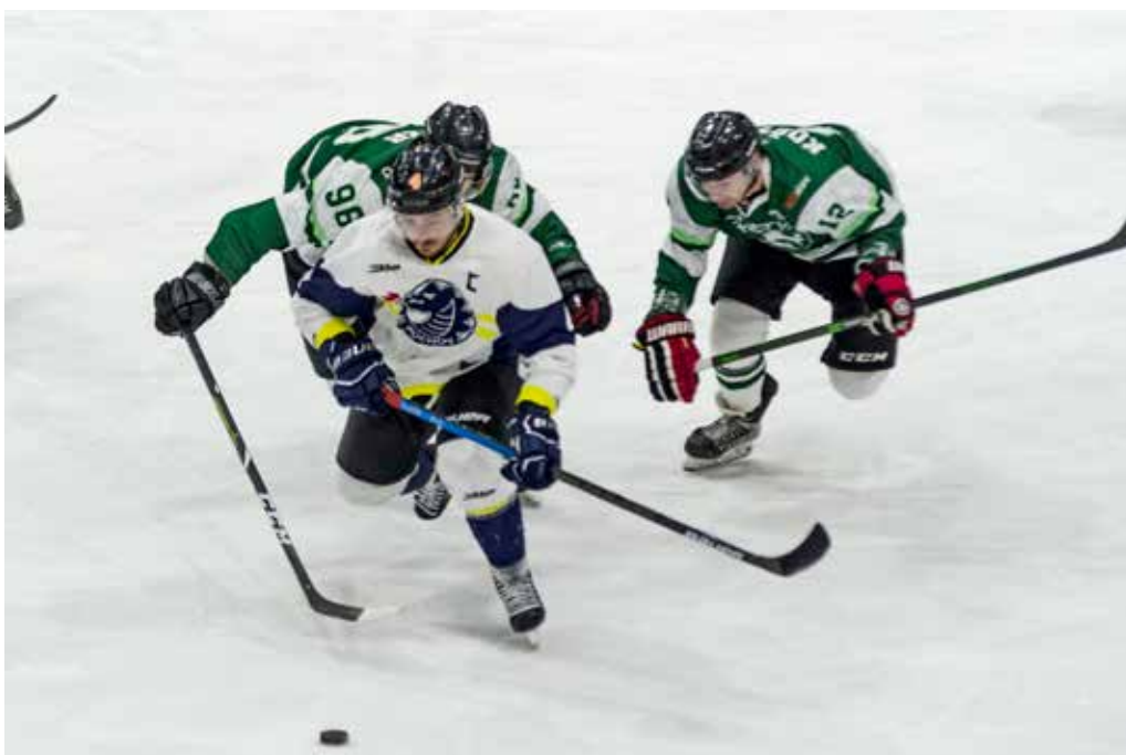
Muži MŠK Púchov zdolali na domácom ľade lídra druhej ligy.