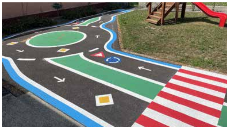
V Materskej škole Mládežnícka došlo k pokládke nového asfaltu pri vstupe do MŠ a k realizácii dopravného ihriska.

pokračovanie v budúcom čísle spracovala: Vanesa Čuríková