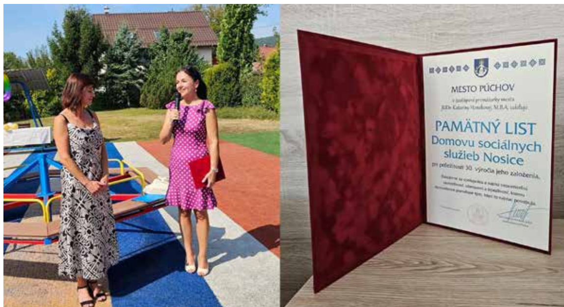
Blahoželáme DSS Nosice k 30'vymročiu a ďakujeme za obetavú prácu pre tých, čo to tak veľmi potrebujú.

Prázdniny sú za nami a zrejme sa už končí aj obdobie horúcich dní, ktorých sme si počas tohto leta dosýta užili. Úspešne sme už zahájili aj nový školský rok, pričom pre všetkých prváčikov mesto opäť pripravilo balíčky plné nevyhnutných potrieb pre každého prváka. Prekvapenia si však pre deti a žiakov pripravili všetky školské zariadenia, a to aj v podobe nových úprav, rekonštrukcií, či inovácií školských priestorov. Všetkým žiakom a študentom prajem ešte raz veľa úspechov v štúdiu, rodičom veľa trpezlivosti a lásky a pedagógom i nepedagogickým pracovníkom veľa zdravia, nadšenia, optimizmu, trpezlivosti a skvelých žiakov.