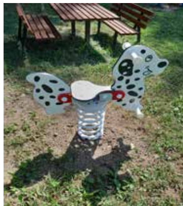
Na školskom dvore sme nainštalovali tri nové hupadlá, jedno dvoj- a jedno štvorsedačkové.

vybavili novým nábytkom vrátane interaktívnych detských kútikov, stolov a stoličiek pre predškolákov, edukatívneho koberca a výučbových magnetických paravánov s lesnou tematikou. Všetkých šesť príručných kuchyniek pri triedach sme vymaľovali a pre pedagógov bola zriadená knižnica. V hospodárskom pavilóne sme opravili sklad čistiacich prostriedkov, kde sa nanovo stierkovalo, maľovalo a doplnili sa regály. Zakúpený bol drobný tovar ako detské obliečky, plachty a pomôcky vrátane detského