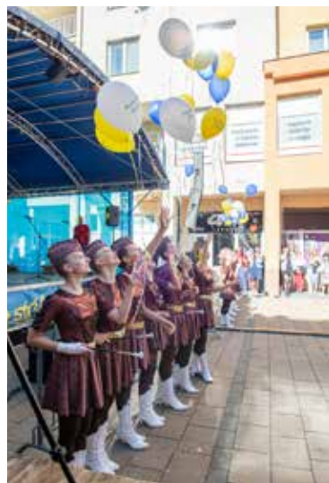
Balóny, ktoré boli vypustené úžasnými mažoretkami a prítomnými na otvorení Púchovského jarmoku, boli z ekologického materiálu, ktorý je rozložiteľný v prírode.

Predviedli sa aj folkloristi z FS Váh a LH Váh Púchov, po ktorých nasledovalo vystúpenie FS Váh Srdcom Púchov. Vrcholom popoludňajšieho programu bolo vystúpenie súboru Zelený veniec, ktorý so svojou ta-