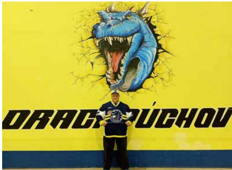
Na zimnom štadióne pribudla nová maľba od verného fanúšika

Hokejisti MŠK Púchov vstúpili do novej sezóny 2. ligy dominantným spôsobom, keď v prvom kole rozdrvili HC Prievidza na ich ľade 8:2. Obhajca minu-