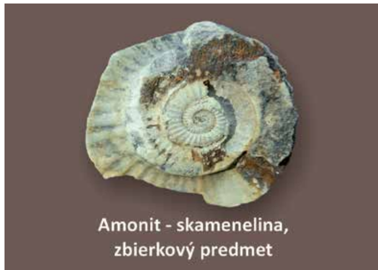
Amonit - skamenelina, zbierkový predmet

autor: Žaneta Adamčíková grafika: Janka Chudovská