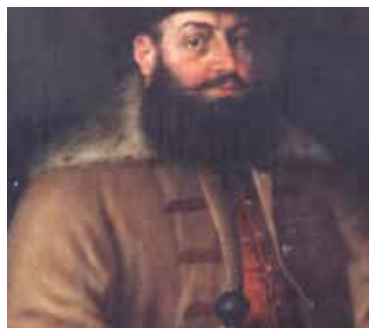
Palatín Juraj Thurzo

Azda každý pozná notoricky známy film Císařův pekař – Pekařův císař , v ktorom český herec Jan Werich stvárnil panovníka Rudolfa II. Habsburského ako kráľa zaujímavého sa viac o alchýmiu, umenie a ženy ako o samotnú vládu. Hoci legendárna komédia nezodpovedá historickej pravde, my sa jej pokúsime priblížiť prostredníctvom dobového prameňa a bližšie sa pozrieme nielen na naše panstvo, ale predovšetkým nanajstaršie miestne priezviská poddaného obyvateľstva.