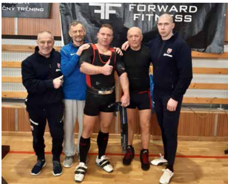
Pretekárom srdečne gratulujeme k dosiahnutým výsledkom a výkonom.