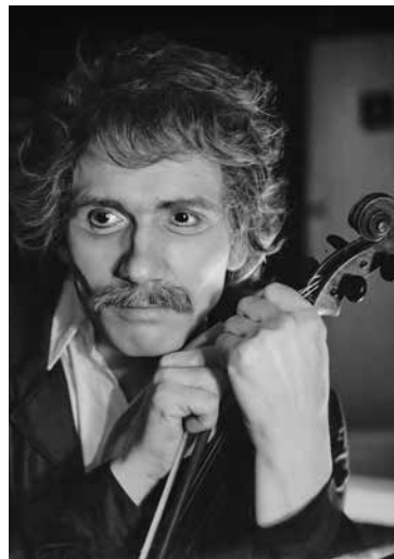
Laco Kunst - Einstein „Fyzici“

Dej sa odohráva v sanatóriu doktorky von Zandovej, ktorá je pre pacientov, trpiacich depresiami, starostlivou oporou. Zvláštnu pozornosť venuje trojici pacientov, ktorí sú „náhodou“ všetci bývalými