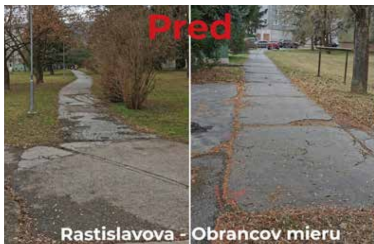
Rastislavova - Obrancov mieru