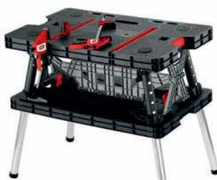
Pracovný stôl Keter Rozmery: 85x55x75,5 cm Max. odolnosť: 435 kg