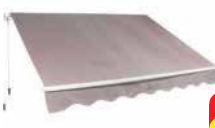
Markíza STREND PRO Rozmer: 2 x 3 m