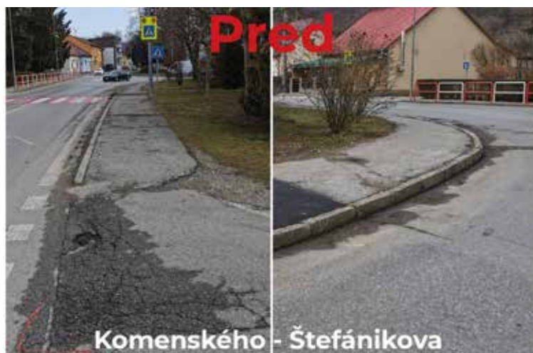
Komenského - Štefánikova