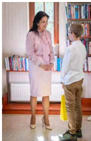
Oceňovanie víťazov literárnej súťaže „Čarovanie perom“