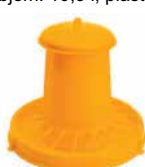
Krmítko pre hydinu Objem: 10,5 l, plastové