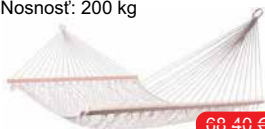
Hojdacia sieť MISHA Rozmer: 200 x 150 cm Nosnosť: 200 kg