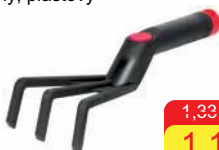
Kyprič pôdy ST Pro Herrison ručný, plastový