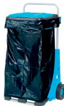
Vozík na záhradný odpad Rozmery: 53 x 38 x 90 cm