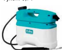
Akumulátorový postrekovač Objem: 5 l Výkon: 3,7V