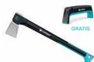
Štiepacia sekera C2000