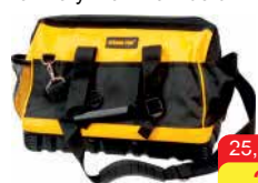
Braňa na náradie Rozmery: 40 x 20 x 36 cm