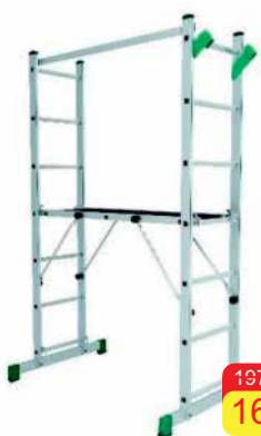
Pracovná plošina Rozmery: 2 x 0,46 x 0,15 m