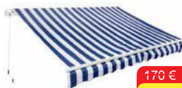
Markíza COVENTINA Rozmer: 2 x 3 m