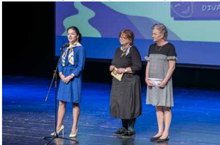
Otvorenie súťažnej prehliadky detských divadelných súborov „Rozprávkové javisko“

Začínam slovami M.R. Štefánika, a to nie bezdôvodne. Tieto slová veľkého Slováka totiž nájdete na Pamätníku tragédie a úcty, ktorý budeme spoločne slávnostne odhaľovať 30. apríla v Europarku, a to pri príležitosti osláv 80. výročia oslobodenia mesta od fašizmu. Pripomienka udalostí pred 80 rokov bude súčasťou trojdňového programu, ktorého prehľad nájdete v aktuálnom vydaní Púchovských novín. Verím, že využijete možnosť a prídete sa pozrieť na fotografie, výtvarné diela, filmy, zúčastníť sa prednášky odborníkov z Ústavu pamätí národa, ale i Múzea holokaustu a vypočuť si nádherný koncert Orchestra ozbrojených síl SR. Nebude chýbať ani lampiónový sprievod s bubnovou a ohňovou šou a Vatra oslobodenia. Ste srdečne vítaní a verím, že strávite s nami tieto oslavy víťazstva nad fašizmom.