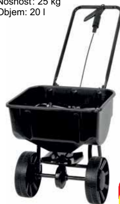
Rozmetadlo sypkých materiálov Nosnosť: 25 kg Objem: 20 l