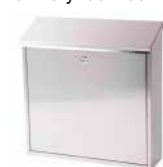
Nerezová poštová schránka Rozmery: 36 x 36 x 10 cm