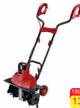
Kultivátor Worcraft Príkonn: 1500W Napájanie zo siete, 230V