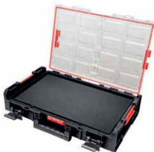
Box QBRICK Organizér XL Rozmery: 58,2 x 38,7 x 13,1 cm