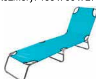
Lehátko PANAMA Rozmery: 188 x 55 x 27 cm