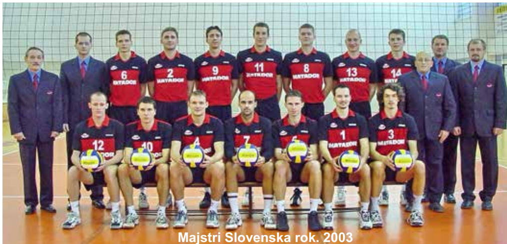
Majstri Slovenska rok. 2003