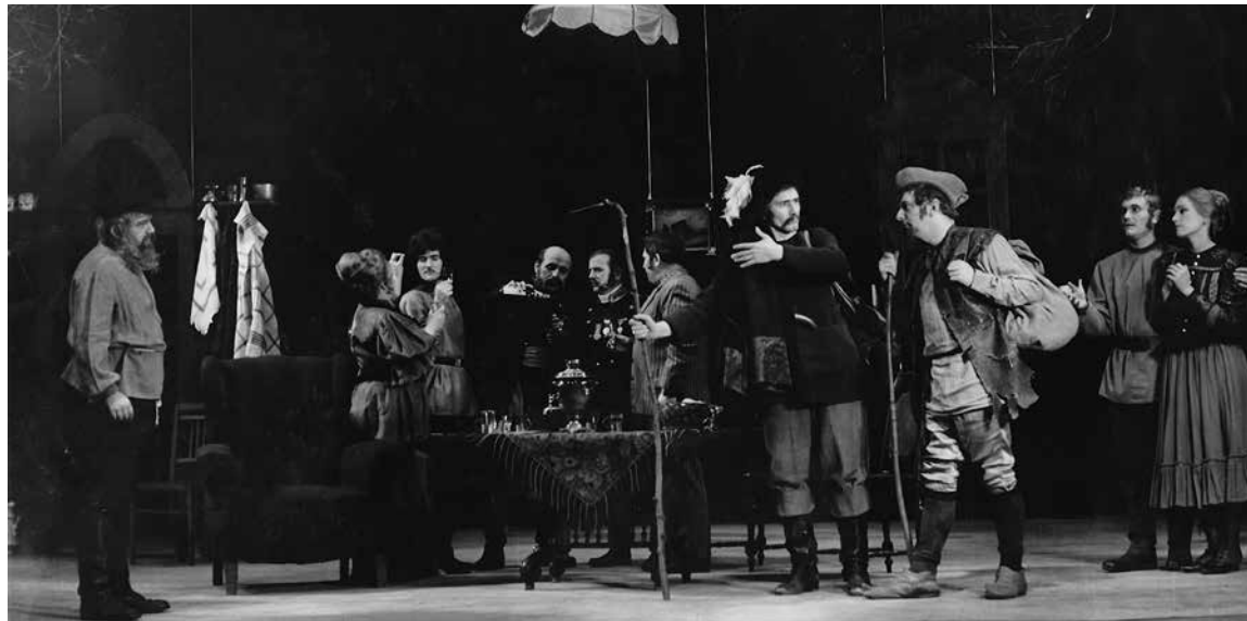
Ostrovský - „Les“ (1970) - záverečná scéna

Niečo musí skončiť, aby mohlo prísť niečo nové. Aj takto by sa dal charakterizovať začiatok 70. rokov, ktorý otvára novú kapitolu v činnosti DS Makyta už v novom Dome kultúry. Prostredie úžasné, priestor javiska veľký a ešte k tomu hlboký, technické vybavenie.... tých naj by sa našlo veľa. Ale súbor si uvedomuje veľkú slabinu, na ktorú ich už dávnejšie upozorňovali divadelné osobnosti a súťažné hodnotiace poroty – čím ďalej viac sa vynárajú generačné problémy. Prvá veľká etapa práce, poctivosti a tiež slávy tých, ktorí sa