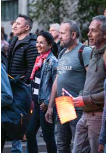
Oslavy 80. výročia oslobodenia mesta Púchov od fašizmu „Lampionový sprievod“