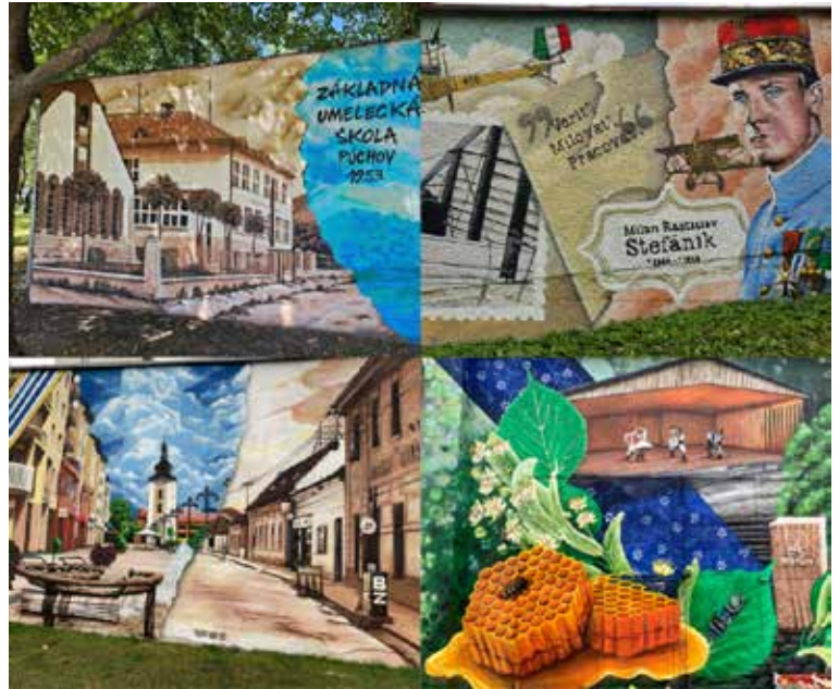
Obnovené trafostanice - autor: Martin Kremeň

Hlavným cieľom projektu je zveľadenie fasády spoločných garáží lemujúcich ulicu Okružná v meste Púchov formou umeleckej maľby pod taktovkou púchovského umelca Martina Kremeňa. Obyvatelia mesta Púchov veľmi pozitívne reagovali už na uskutočnené obnovy trafostaníc v meste, ktoré boli realizované v predchádzajúcich rokoch 2022, 2023, 2024. Maľby boli