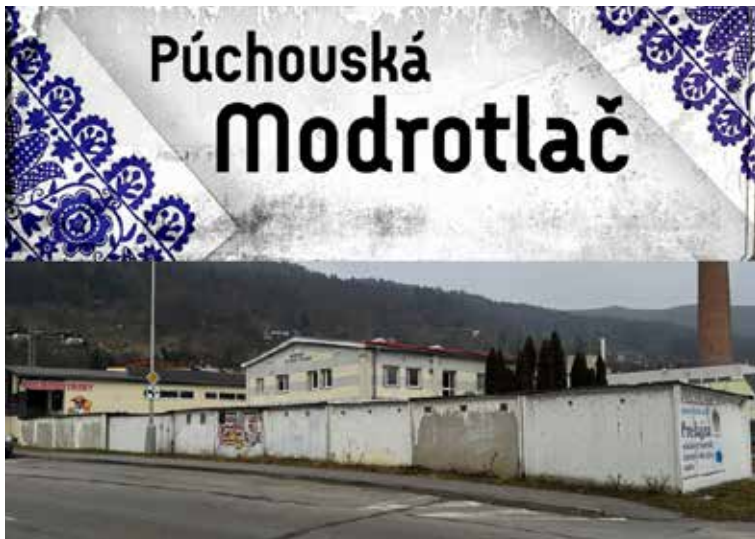
Fasády spoločných garáží na ulici Okružná

inšpirované názvami púchovských ulíc, tematikou súčasného i historického Púchova a okolitou prírodou. V tejto aktivite a spolupráci chceme pokračovať aj v roku 2025 s finančnou podporou Trenčianskeho samosprávneho kraja. V roku 2025 chceme umeleckou maľbou stvárniť tému púchovskej modrotlač.