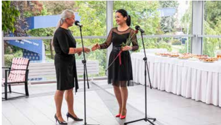
Otvorenie vernisáže „Metamorfózy - od vlákna po produkt“

Tento areál bol už aj „pokrstný“ prvými pretekmi, keďže pár dní po otvorení školského areálu na Goraz-