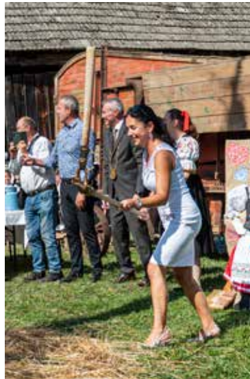
Dožinky v Lednici

oplotenia tejto materskej školy a samozrejme všetkým zamestnancom škôlky a rodičom, ktorí pomáhali pri sťahovaní a upratovaní škôlky a jej okolia. Spoločne tak vytvárame krásne dielo nielen pre súčasnosť, ale aj pre ďalšie generácie detí, ktoré budú túto škôlku navštevovať. Ste dôkazom toho, že vám záleží na našom meste a na prostredí, v ktorom vyrastajú naše deti. V aktuálnom vydaní Púchovských novín sa dočítate o tejto akcii viac, ale aj o ďalších zmenách a úpravách, ktorými prešli ostatné škôlky v meste.