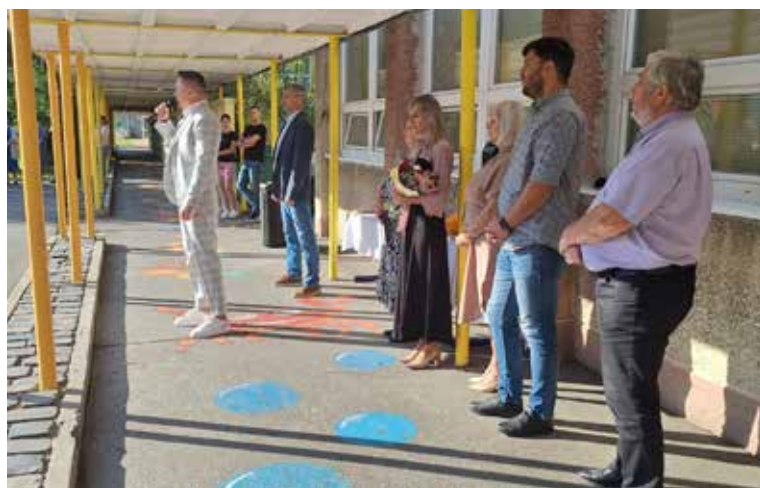
ZŠ s MŠ Slovanská

mesta. Všetkým žiakom prajeme veľa chuti do učenia, aby mali počas celého školského roka dostatok zvedavosti, odvahy a chuti objavovať nové veci. Nech je tento školský rok plný nielen vedomostí, ale aj zážitkov a priateľstiev.