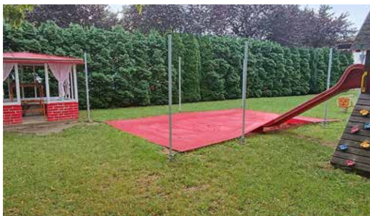
MŠ Požiarna 1291

V MŠ Požiarna 1291 sa deti tešia zo zrenovovaného pieskoviska, ktoré je teraz chránené tieniacou plachtou. Opravený a nanovo natretý bol aj záhradný domček, ktorý dostal aj