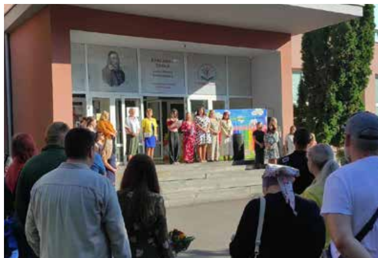
ZŠ Jana Amosa Komenského

skej pôsobnosti – ZŠ Mládežnícka, ZŠ Gorazdova, ZŠ Komenského a ZŠ s MŠ Slovanská. Balíčky však dostali aj prváčikovia navštevujúci školy mimo zriaďovateľskej pôsobnosti mesta – ZŠ s MŠ sv. Margity a Spojenú školu na ul. Športovcov 1461/17.