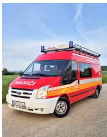
Nový DA Ford Transit

O všetkých aktivitách pravidelne informujeme na sociálnych sieťach (Facebook, Instagram) alebo na obecnej stránke. V spolupráci s obcou sa podieľame na rôznych akciách, ktoré aj sami usporadúvame: Majáles, Hasičská vareška, fašiangový pochod, MDD, hodová vatra, Mikuláš pre deti či besedy a ukážky v škole a škôlke. Taktiež sa staráme o prídelenú techniku, pravidelne preštruktúrovame agregáty a absolvovali sme kurz základnej prípravy členov hasičských jednotiek či kurz pilčíka.