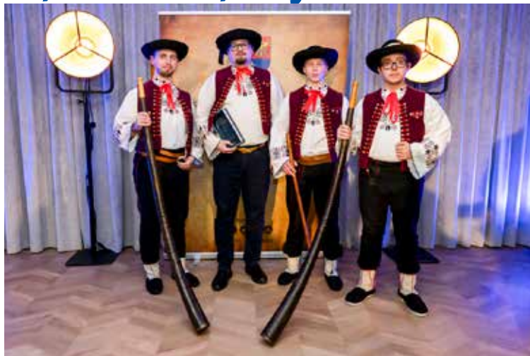
Folklorný súbor Váh získal Cenu TSK