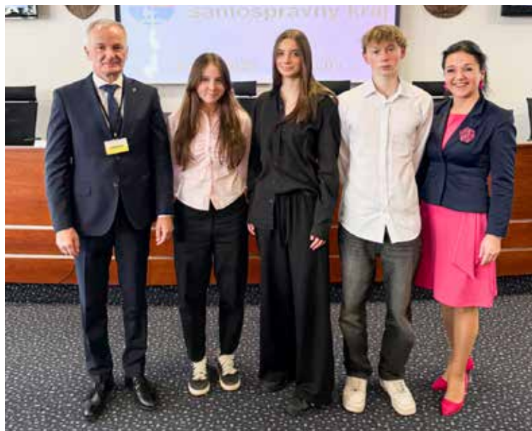
Ocenení študenti z Gymnázia v Púchove