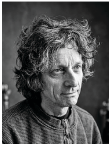
J. Ciller v časoch „Pathelinovskej slávy“